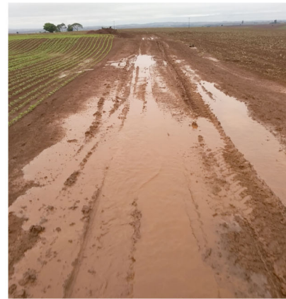
Situação da Estrada da Figueira, em Rolândia, em dias de chuva

O secretário também afirmou que houve um momento onde a prefeitura fez um programa de licenciar pedreiras, mas o projeto acabou não indo para frente. "Fizemos licitação para uma empresa para fazer todo processo, e teve apenas três pedreiras que se interessaram, mas a gente procurou vários proprietários de pedreiras