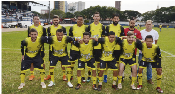
Amigos do Xuxa/Bar do Paquinha é o atual campeão do Torneio 1º de Maio em Rolândia: venceu em 2019

Organizado pela Secretaria Municipal de Esportes de Rolândia, o Torneio do Trabalhador 2022 terá 14 partidas neste domingo (10). Dos times vencedores, sete disputam a rodada do dia 24 de abril e sete seguem direto para a fase final no dia 1º de maio –