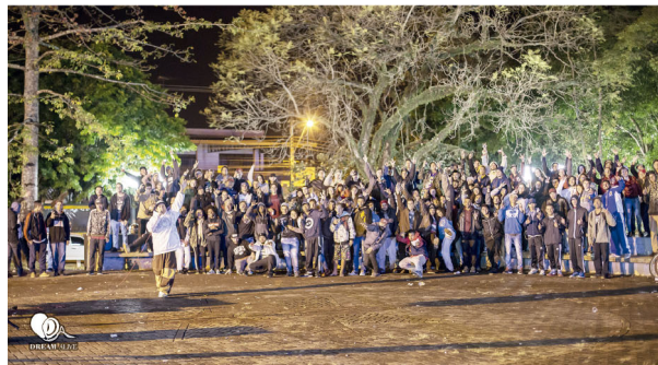
Primeira Batalha de Rimas em agosto de 2018

■ Após mais de dois anos, Batalhas da Independência voltam a ser realizadas na praça Castelo Branco