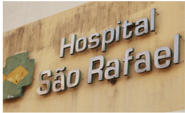
Hospital São Rafael atende a cerca de 10 municípios da microrregião de Rolândia

Em 25 de novembro de 2021, o Hospital São Rafael completou 65 anos. Foi fundado em novembro de 1957 por um grande grupo de imigrantes alemães com o nome de 'Fundação Arthur Thomas'. Em dezembro de 1966 a Assembleia Legislativa do Paraná o reconheceu legalmente: neste ano termina a Fundação e se declara a Associação Beneficente São Rafael, nome fantasia Hospital São Rafael, de Utilidade Pública estadual. Em âmbito federal, o reconhecimento como