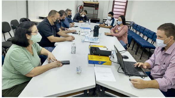
Fomento à economia e ao comércio é uma das preocupações do Comitê Gestor da Lei Geral

■ Comitê Gestor da Lei Geral de Cambé propõe mecanismo para fomentar o comércio local e aquecer a economia do município