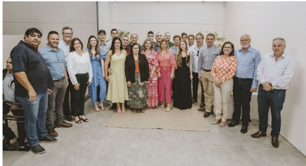
Autoridades e empresários de Jaguapitã e Rolândia prestigiarão a inauguração do Boa Compra

Aberto de segunda a sexta (8h30 às 20h30), sábados (8h30 - 20h), domingos e feriados (9h às 18h)