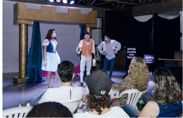
Secretaria de Cultura disponibilizou 90 vagas para as aulas de teatro

Se você sonha ou já sonhou em se apresentar em grandes palcos, com plateias lotadas e no centro dos holofotes, esse pode ser o passo inicial para que a sua carreira no teatro comece. A Secretaria de Cultura de Cambé está com turmas abertas para oficinas de teatro, disponíveis para toda população. As aulas começam na terça (16) e estão disponíveis 90 vagas.