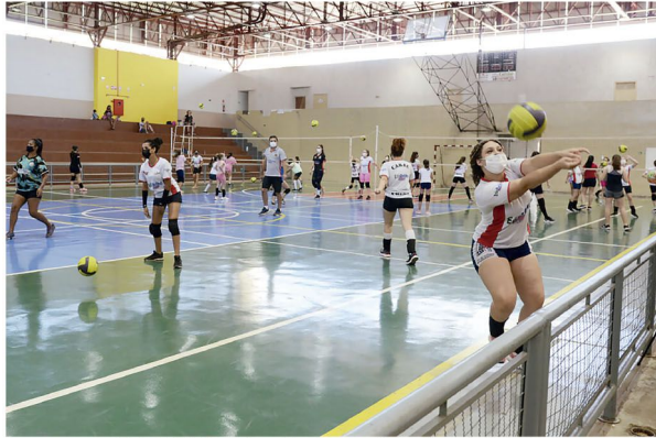
Mais de 300 alunas do projeto devem participar do evento deste sábado

■ Festival do Projeto Cambé Vôlei deve reunir mais de 300 alunas neste sábado no Ginásio João de Deus