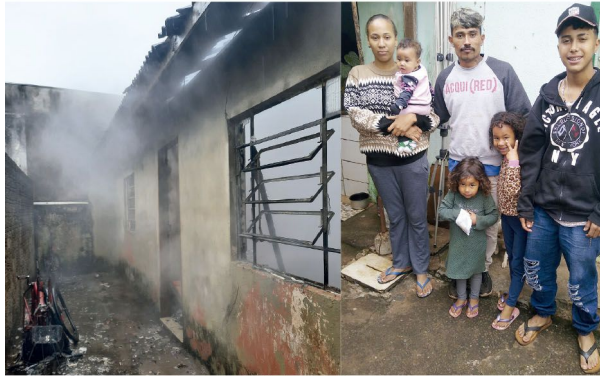
Estado da casa alugada pela família de Poliana (fotos tiradas em datas diferentes)

■ Incêndio aconteceu na terça-feira em residência da Vila Oliveira; havia 5 pessoas na casa no momento, três delas eram crianças