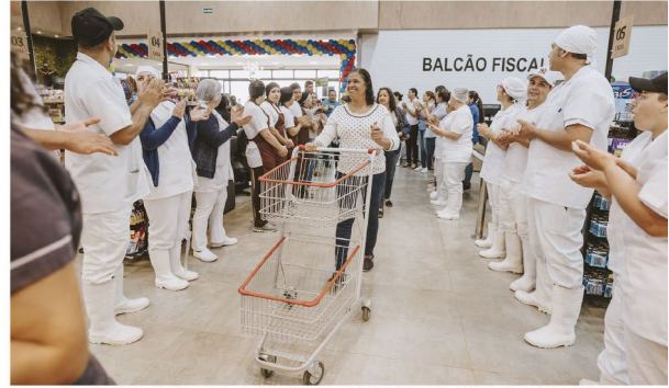
Os primeiros clientes entram no Boa Compra de Jaguapitã, aplaudidos pelos colaboradores

O supermercado Boa Compra de Jaguapitã tem um número de WhatsApp exclusivo para os moradores da cidade e dos ar-