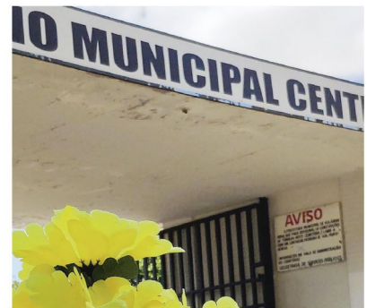
Cemitério Central de Rolândia

O horário de visitação no ‘Dia dos Pais’ será das 7 horas até as 18 horas em três cemitérios da cidade: no Central, no distrito do Bar-