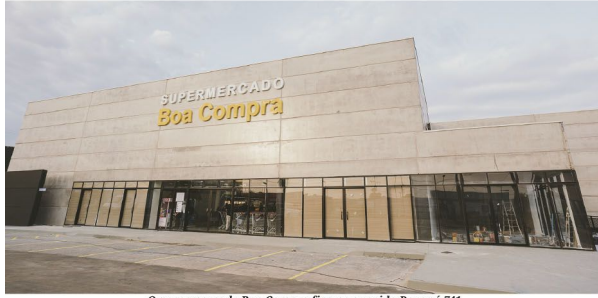
O supermercado Boa Compra fica na avenida Paraná 741

■ Supermercado Boa Compra, do Grupo rolandense, já atende no município de Jaguapitã desde a sexta-feira da semana passada