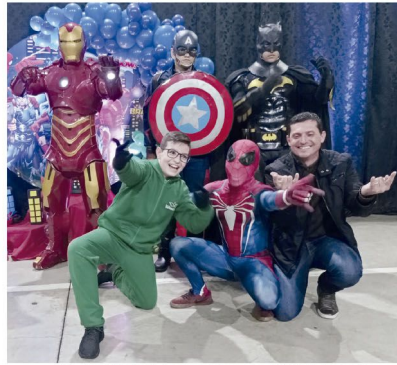
Os super-heróis fizeram sucesso com os filhos e os pais

“Foi um momento mágico, inesquecível, super especial. Alguns pais relataram que as crianças mal dormiram de tanta alegria e entusiasmo após o encontro super emocionante com os heróis”,