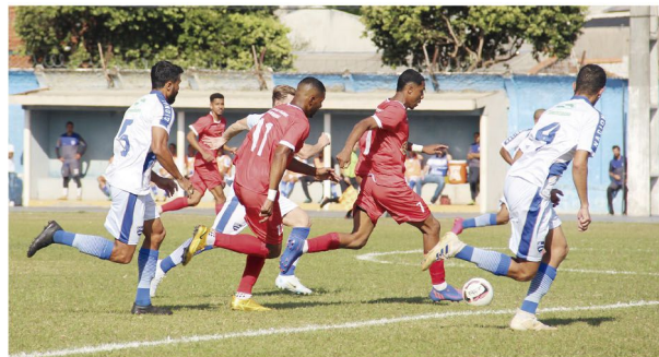
O Paranavaí, chamado de Vermelhinho, vai ao ataque contra o Nacional

Derrota em casa para o Paranavaí e vitória do Arapongas deixam o NAC em 3º no grupo B; time rolandense folga na próxima rodada