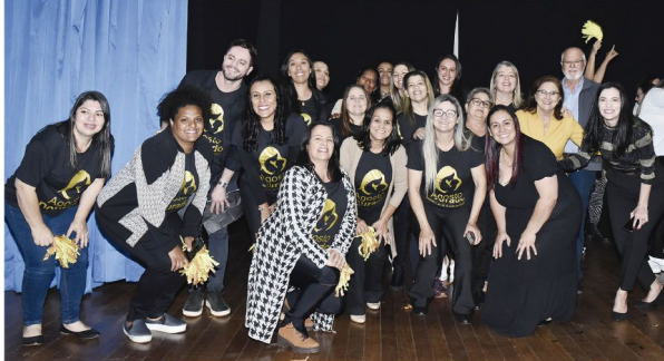
A UBS do Santiago ficou em segundo lugar e a UBS do Parigot terminou na 3ª colocação