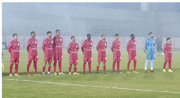
A equipe do REC perfilada antes da partida em Maringá

Time rolandense foi goleado pelo Grêmio Maringá na noite da quarta-feira no estádio Willie Davids, em Maringá