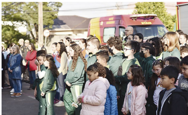
Apesar do frio, os alunos e as alunas acompanharam o momento cívico

As ações da semana cívica são tradicionais em Rolândia e acontecem com a participação de estudantes das escolas municipais, Centros Municipais de Educação Infantil e diversas entidades parceiras.