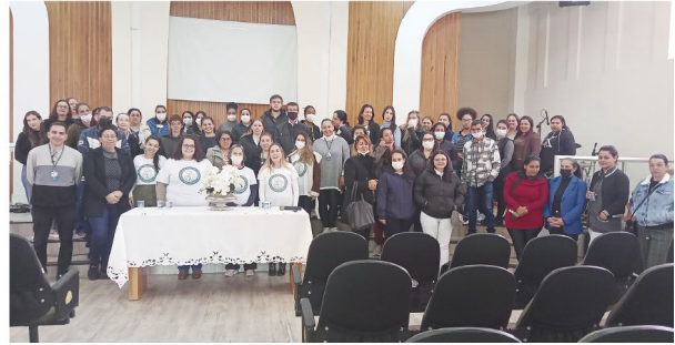
Capacitação foi realizada na Igreja Presbiteriana Independente do Brasil

■ Instituição fez capacitação com colaboradores para explicar os pontos que envolvem a conquista do selo da Iniciativa Hospital Amigo da Criança