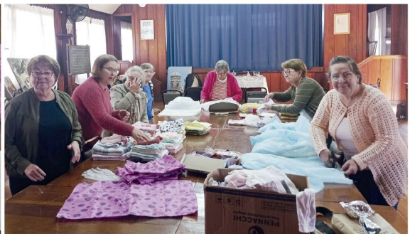
Acima, detalhe dos Kits, preparados pelas membras da OASE; algumas delas estão na foto

tu para a participação ativa de mulheres na vida da comunidade. Esta participação se expressa nos três aspectos da vida cristã: comunhão, testemunho e serviço. O grupo de Rolândia existe desde 1950, mas a Ordem foi criada em 15 de agosto de 1899 na cidade de Rio Claro, estado de São Paulo.