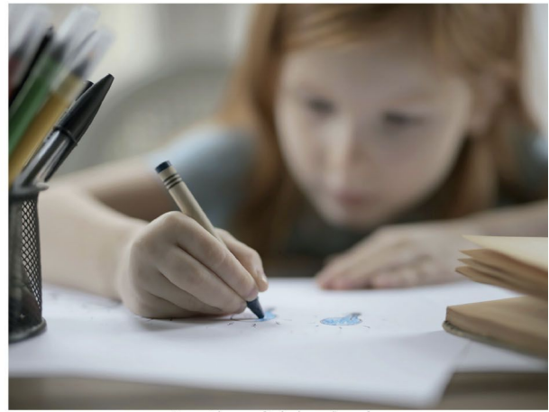
Busca Ativa quer diminuir evasão escolar

Neste cenário, muitas meninas e muitos meninos que já estavam em situação de vulnerabilidade não estão conseguindo ter acesso à aprendizagem em casa, correndo o risco de não regressar às escolas que já estão todas reabertas e atendendo presencialmente. “E quem já estava fora da escola antes da pandemia precisa ser identificado e levado de volta. Neste momento, é fundamental