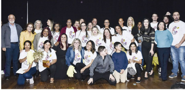
A UBS da Vila Oliveira foi a grande campeã das paródias

■ Evento foi promovido pela Secretaria de Saúde de Rolândia como encerramento do 'Agosto Dourado'