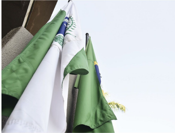
As bandeiras do Brasil, do Paraná e de Rolândia foram hasteadas no paço

■ Hasteamento da bandeira em frente à prefeitura municipal na manhã da quinta-feira deu início à Semana da Pátria