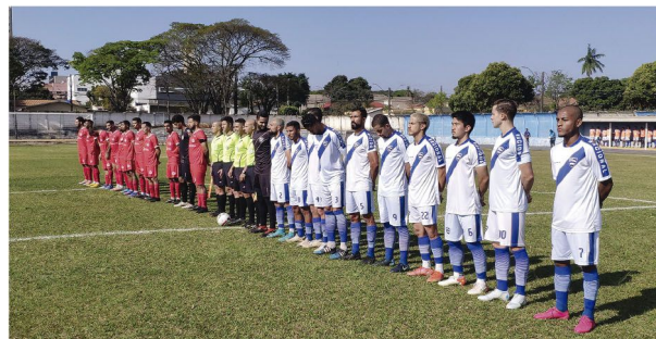
Os jogadores do Nacional e do Paranavaí e o quarteto da arbitragem antes dos hinos do Brasil e do Paraná

Próximo jogo O Nacional folga na próxima rodada, neste final de semana, e só volta a jogar, fora de casa, contra o Arapongas no dia 11 de setembro - o estádio ainda não foi definido pela Federação Paranaense de Futebol. O Arapongas tem mandado seus jogos em Paranavaí, mas pode jogar no José Garbelini, em Cambé, se o estádio for liberado.