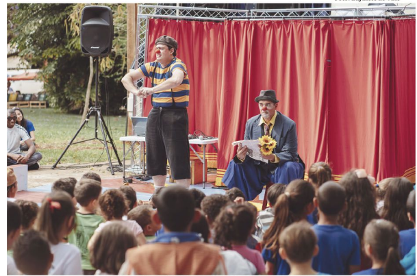
Espectáculo circense promete risadas do começo ao fim

Antes de Rolândia, o espetáculo esteve em Assaí o dia 07; Santo Antônio da Platina no dia 08; Apuca-