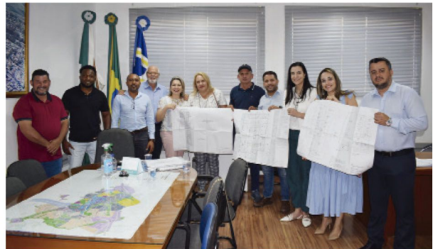
Vereadores abraçaram o projeto da nova sede do Samu/TEC e destinaram a emenda impositiva de 2023 para tal fim

Obra será feita com emendas impositivas dos vereadores e vereadoras de Rolândia em um valor total de R$ 1,9 milhão