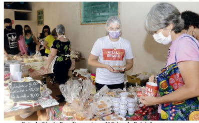
mostra a 1ª Feira do Deizinho em março

Durante a parte da manhã, na 2ª Feira do Deizinho, haverá a venda de