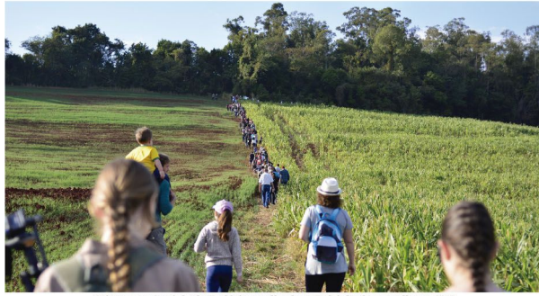
Acima, uma Caminhada Ecológica realizada no Deizinho do vermelho em 2015

■ Útil ao agradável: eventos foram 'unificados' por ocorrer no mesmo dia na comunidade rural de Rolândia