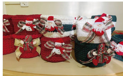
Cachepôs e guirlandas estão entre as peças natalinas feitas à mão

■ Promovido pelo Grupo de Voluntárias Irmã Isméria, aguardado bazar começa dia 16 com belíssimas peças para decorar e presentear