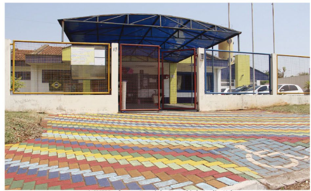
O CMEI Professora Terezinha Bertochi, do Jardim Nobre

A inauguração desse novo CMEI vai ajudar a desafogar a lista de espera por vagas que existe hoje em Rolândia. “A lista de espera por vagas tem cerca de 450 crianças com até 3 anos de idade. É importante que essas pessoas que