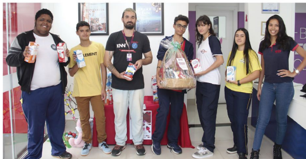
Alunos e colaboradores da KNN Rolândia mostram a cesta e parte do leite arrecadado

A campanha Páscoa Solidária, da KNN Rolândia, que está arrecadando litros de leite para o Hospital São Rafael, faz o sorteio de uma cesta de Páscoa neste sábado (29). O evento será transmitido ao vivo pela Facebook do JR (UmJornalRegional), diretamente da KNN Idiomas, a partir das 15 horas.