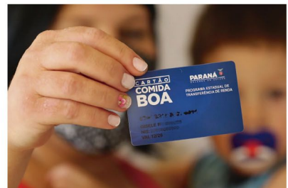
O cartão Comida Boa

do no município e a Secretaria de Assistência Social distribui ao Centro de Referência da Assistência Social (CRAS) mais próximo da família, que é informada para a retirada do benefício.