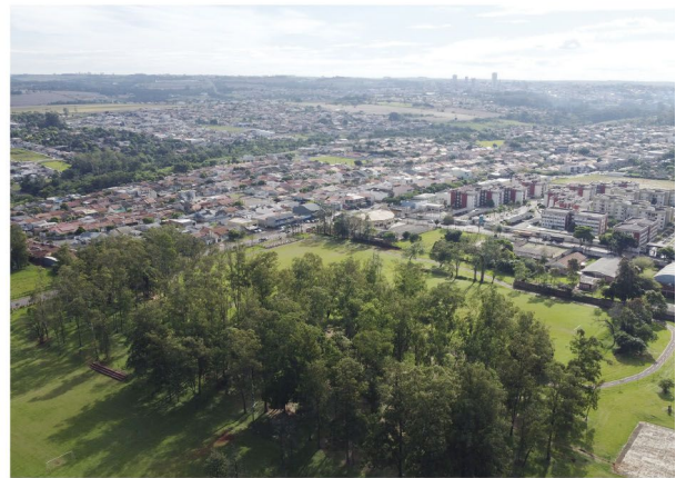
O Centro Esportivo Castelo Branco, onde acontece a Festa do Trabalhador em Cambé

Já a Secretaria de Assistência Social e Cidadania promove uma atividade de conscientização sobre o trabalho infantil para crianças de 6 a 12 anos através de brincadeiras. Também haverá estações de mini futebol, voleibol, queimada e jogos livres como bambolês, cordas e materiais sobre trabalho infantil. Estão previstas também duas gincanas com brincadeiras como estafetas, corrida do ovo, corrida do saco, corrida de tênis e joquempô gigante. Todas as crianças que participarem da gincana ga-