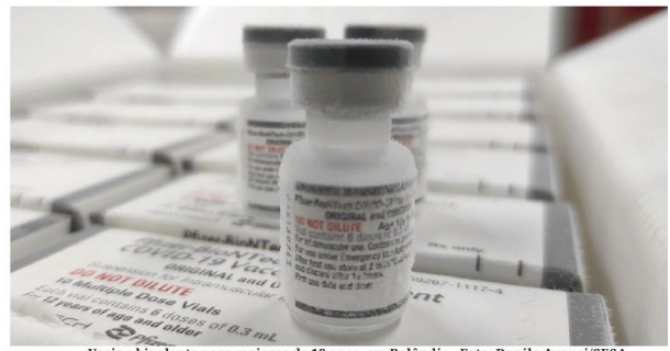
Vacina bivalente para maiores de 18 anos em Rolândia - Foto: Danilo Avanci/SESA

Neste momento o público-alvo ainda são as crianças de 6 meses a 5 anos, gestantes e puérperas, povos indígenas, trabalhadores da saúde, idosos com 60 anos ou mais, professores das escolas públicas e privadas, pessoas com doenças crônicas não transmissíveis e outras condições clínicas especiais,