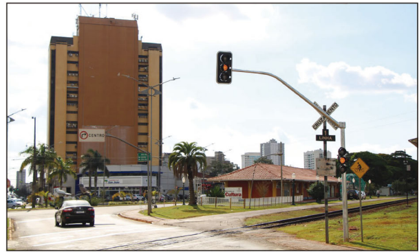
A fase final da implantação de sensores inteligentes começou na sexta-feira passada em Arapongas

– Sempre pare o veículo antes de realizar a travessia e certifique-se de que não há trens se aproximando – Para realizar uma traves-