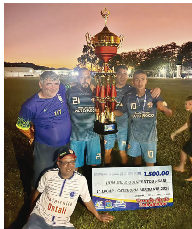
A equipe rolandense Serralheria Nobre/Sistevac venceu a categoria Aspirantes em Jaguapitã

A Secretaria de Esportes de Jaguapitã promoveu dois torneios do Trabalhador: de Aspirantes e de Titulares. O Aspirantes foi vencida pela equipe rolandense Serralheria Nobre/Sistevac, que levou R$ 1,5 mil, e teve o raridade, de Jaguapitã, como vice (leveu R$ 1 mil). A categoria Titulares foi vencida pelo