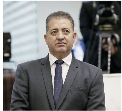
O deputado estadual Cobra Repórter

plados com recursos por indicação do deputado Cobra foram Arapongas, Cambé e Uraí com R$ 1 milhão cada para a construção de uma UBS; Ariranha do Ivaí com R$ 65 mil para a compra de um veículo; Guapirama com R$ 315 mil para a compra de um veículo e uma ambulância; Porecatu com R$ 950 mil para a compra de duas ambulâncias e um micro-ônibus; Rolândia com R$ 250 mil para a compra de uma ambulância; Sabáudia com R$ 470 mil para a compra de uma van para transporte de pacientes.