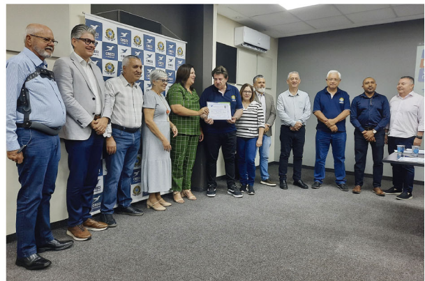
Café da manhã com Presidente do Creci-PR foi realizado no Blumen Park, em Rolândia

■ Corretores rolandenses assumem cargo no Conselho, que também homenageou ao prefeito e ao presidente da Câmara Municipal