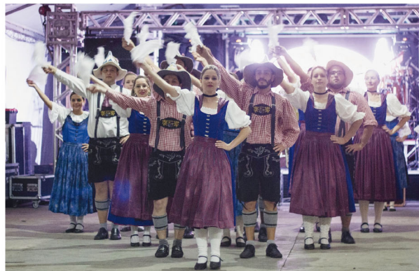
Weisser Schwan se apresentando na cidade de Entre Rios (SC) em 2014