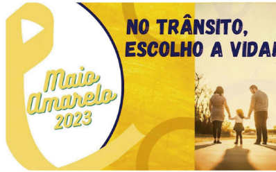
Cartaz da campanha do Maio Amarelo em Cambé

Com isso, além de ações que serão feitas pela Secretaria Municipal de Segu-