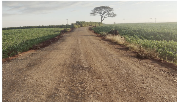
Depois de mais de 20 anos, a Estrada da Figueira finalmente totalmente empedrada

E a luta foi longa mesmo. As melhorias na estrada eram pedidas há mais de 20 anos e apenas medidas paliativas eram feitas, isso a despeito da Estrada da Figueira ser uma das mais utilizadas na zona rural de Rolândia. A via é utilizada por aproximadamente 15 famílias, que vivem na região rural, e cerca de 20 produtores rurais que