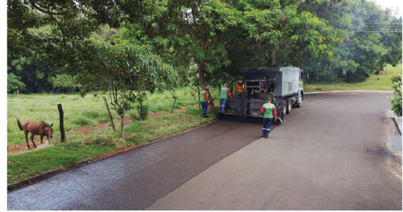
Em Cambé, experiência com CBUQ e micropavimentação tem dado certo

■ Em apenas três meses de 2023, prefeitura de Cambé revitalizou mais de 58 mil m 2 de asfalto