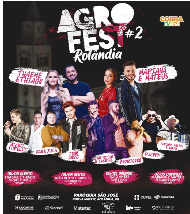
Cartaz da festa com todos os artistas e seus shows

A ação acontece durante a 2ª AgroFest e o grupo tem um estande na Praça da Igreja Matriz. Nos dias 04 e 05, o bazar vai atender das 19 às 22 horas. No sábado (06), o atendimento será das 10 às 22 horas, e, no domingo (07), o bazar vai funcionar das 10 às 14 horas. São peças com o valor entre R$ 5 e R$ 50, que podem ser pagas em dinheiro ou por pix. O valor arrecadado será destinado para a reforma do Pronto Socorro do hospital, bem como na compra de enxovais.