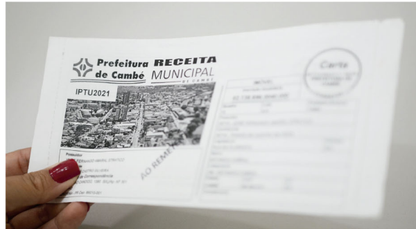
O IPTU é um dos impostos que podem ser refinanciados em Cambé

■ Prefeitura de Cambé prorroga o Programa de Refinanciamento Fiscal por mais dois meses; prazo termina no dia 1º de agosto