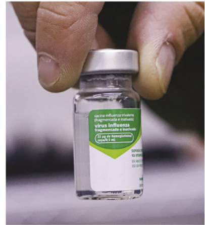
Cobertura mais alta na região é em Arapongas com 58,67%

O município de Prado Ferreira conta com um total de 827 doses aplicadas, para uma população alvo de 1.531 mil pessoas. Até