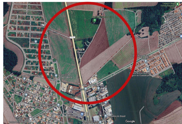
Futuro parque industrial de Rolândia fica na PR-170

Durante o processo de cadastro, também será realizado um mapeamento para identificar possíveis lotes abandonados ou subutilizados por empresários. De