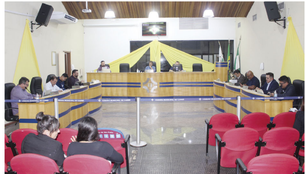
A Câmara Municipal de Cambé durante uma sessão ordinária

■ Dois importantes projetos, o EduCambé e a Lei do Natimorto, seguem para a sanção do prefeito Conrado Scheller; programa CãoBé é discutido