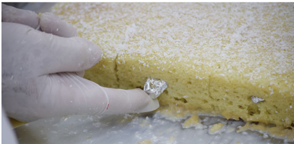
O bolo de Santo Antônio é uma das atrações da festa

■ Festa tem Missas, procissão, bênção de pães e bolo do santo padroeiro