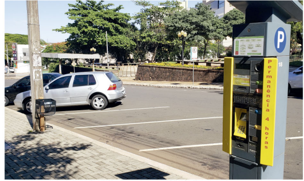
O estacionamento rotativo de Cambé é administrado por uma empresa privada

O procurador também revelou que os cargos de