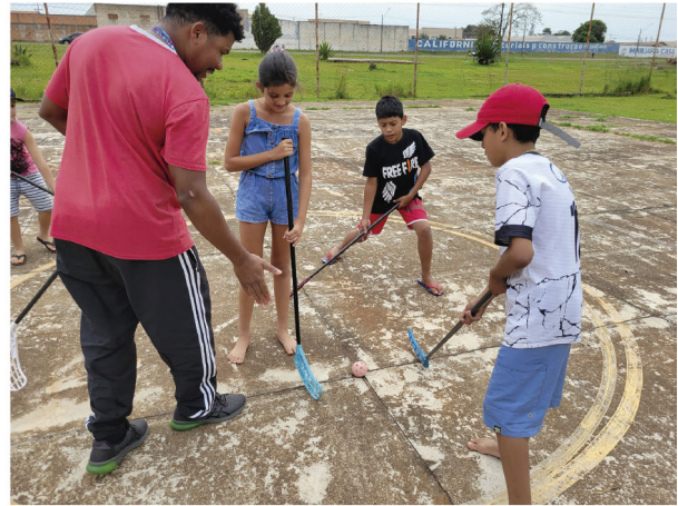
Meninos e meninas podem jogar juntos o esporte

“O floorball é um esporte coletivo de invasão, no qual meninas e meninos podem jogar juntos. Os jogadores utilizam tacos de plástico para movimentar uma bola também de plástico furada, com peso de 23 gramas. O objetivo do jogo