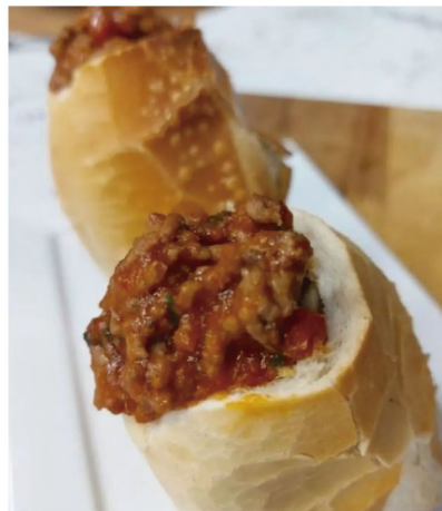
O 'Buraco Quente' é uma das atrações do Arraiá da Unidade