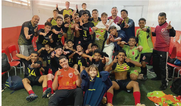
Classificação para a próxima fase e festa no vestiário

■ Equipe rolandense foi uma das terceiras melhores colocadas e avançou para a 2ª fase da competição