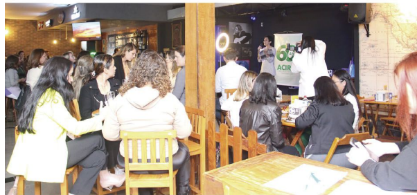
A 1ª Rodada de Negócios do CMEC em dois ângulos no Almost a Pub

■ Evento foi promovido pelo Conselho da Mulher Empreendedora e da Cultura de Rolândia e contou com a participação de 70 mulheres