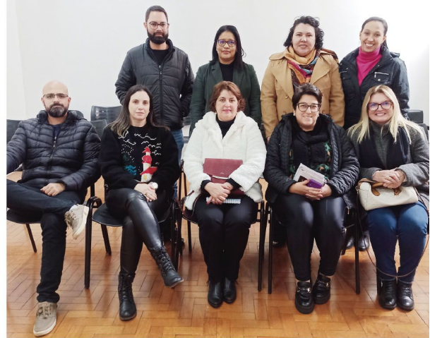
A reunião foi realizada na sede da Assistência Social de Rolândia

Sendo o bullying um dos assuntos que podem ser abordados na sala de escuta ativa, vale complementar que, de acordo com um levantamento qualitativo feito pelo Instituto