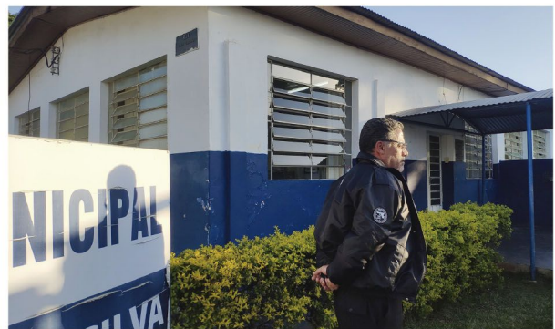
Segurança nas escolas municipais continuam sendo feita

■ Trabalho atual continua até nova empresa vencedora iniciar seu contrato na segurança escolar municipal, que terá pessoas com detetor de metais