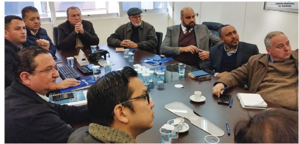
Autoridades de Rolândia na sede da Sanepar em Curitiba

O procurador destacou que o município de Rolândia não possui condições técnicas e financeiras para assumir sozinho os serviços de saneamento, e aguarda a manifestação