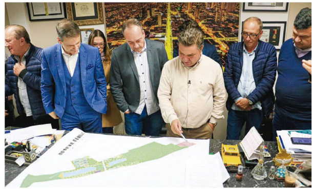
Autoridades durante a liberação de Ordem de Serviço do Parque das Nações