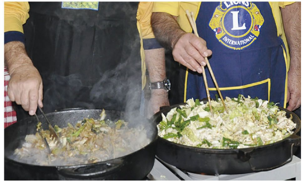
O Sukiyaki do Lions é aguardado pela comunidade rolandense