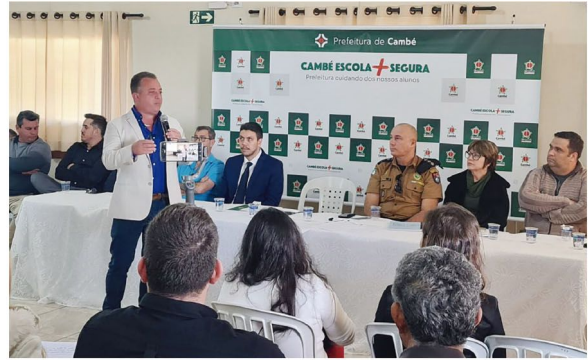
O prefeito Conrado Scheller durante o anúncio do programa contra a violência nas escolas

através do Departamento de Tecnologia da Informação, ainda desenvolveu o aplicativo Botão de Emergências, que será utilizado por professores e agentes educacionais da rede municipal para chamamento imediato das forças de segurança em caso de ataques de agressores.