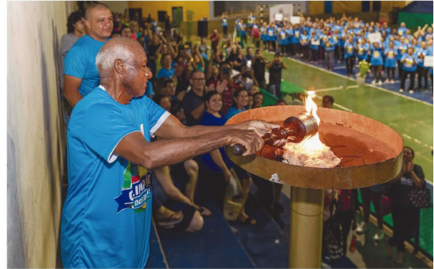
Abertura das Olimpíadas no ano passado

Promovida pela Secretaria Municipal de Esportes e Lazer de Cambé, a VIII Olimpíadas dos Idosos teve a sua abertura na noite da quinta-feira (06) no Ginásio de Esportes João de Deus. Os jogos seguem até a sexta-feira da próxima semana, reunindo 265 idosos atendidos pelo Programa Viva a Vida, Cambé Oportunista, Centros de Convivência do Idoso e Reabilitação Hidroginástica para a disputa de 11 modalidades.