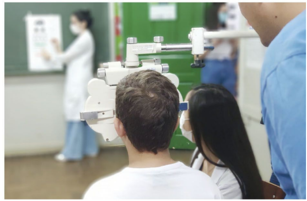
Aluno de Rolândia é examinado durante o "Primeiros Olhares" de agosto do ano passado

Com a continuação do projeto e a realização de eventos especiais, a secretária de Saúde afirma que a ação irá alcançar um número cada vez maior de crianças e promover uma melhoria duradoura na saúde ocular destes alunos da rede municipal.