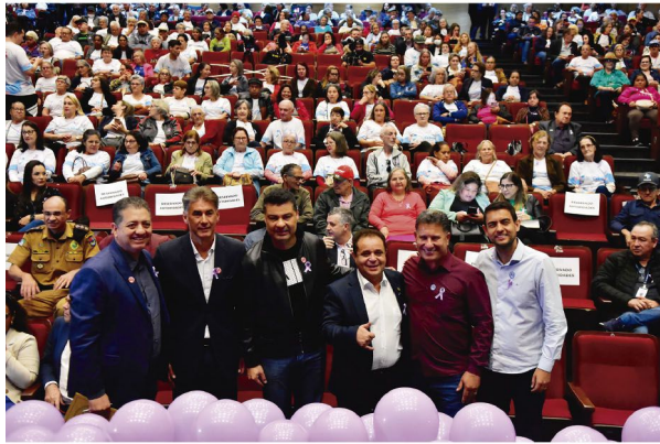
Seminário teve grande participação popular

Durante o período da tarde, no seminário realizado em Cascavel, também houve a apresentação da Banda do Exército Brasileiro pela 15ª Brigada de Infantaria Mecanizada da Polícia Militar.