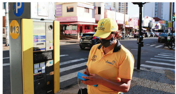
Agente de trânsito e estacionamento rotativo de Uberlândia, em Minas Gerais

todo esse estudo terá uma abordagem cuidadosa e embasada tecnicamente, considerando as peculiaridades de Rolândia, para garantir que as medidas