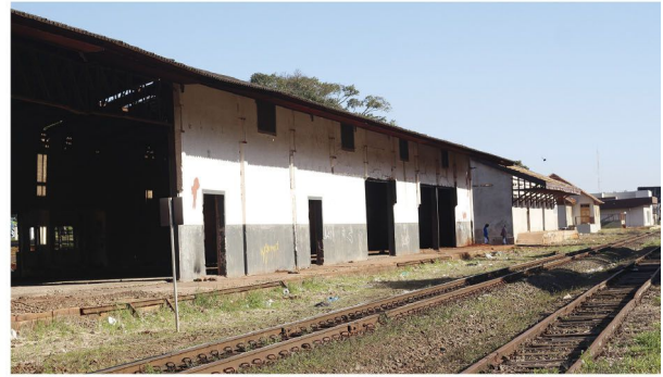
Barracão maior abrigará o Mercado Municipal de Rolândia

Para tanto, a Cultura vai realizar uma licitação para contratação de professores oficinairos. "O Barracão menor do IBC também terá um palco móvel com cadeiras móveis. Esse local que pode ser utilizado para reuniões, pequenos eventos, sem o palco e as cadei-