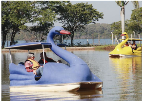
Pedalinho para toda a família e área de camping e para motorhome: tudo isso é ‘Tucuna Pesca e Lazer’