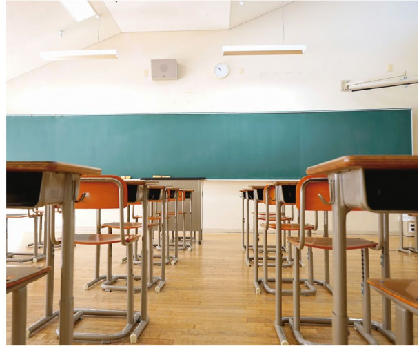
Dias com as salas vazias nas escolas municipais

■ Início das ‘férias’ de julho fica entre os dias 06 e 10 nos municípios da região; retorno às salas de aulas se dá, na maioria dos casos, no dia 24 deste mês