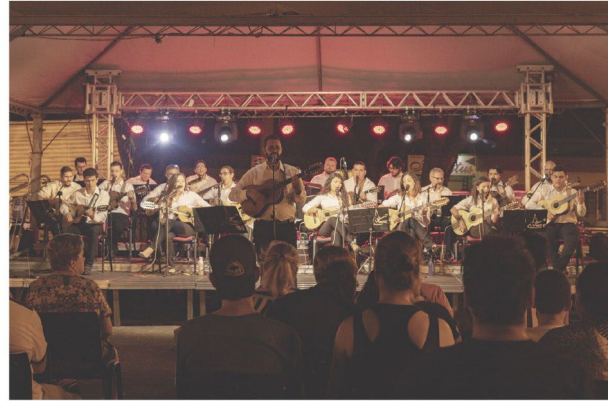
A Orquestra Maringense de Viola Caipira é a atração do domingo

A tarde será marcada pelo aguardado Concurso de Quadrilha, às 14 horas, que promete encantar o público e com premiações em dinheiro para os melhores grupos participantes. Por fim, às 18 horas, será realizada mais uma Santa Missa seguida de uma apresentação da Orquestra Maringense de Viola Caipira, às 19:30, que vai fechar a festa com 'chave de ouro'.