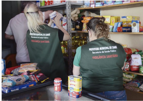
A Ação Integrada de Fiscalização Urbana (AIFU) foi realizada na quarta-feira em busca de irregularidades em estabelecimentos comerciais de Cambé