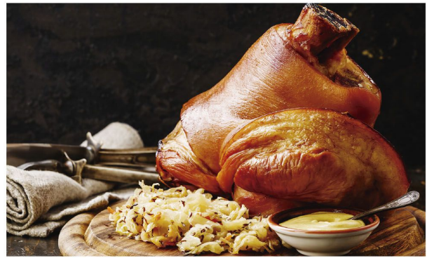
Bora lá em Rolândia comer um 'Eisbein' e dançar no Baile Suíço-Alemão?

Baile Suíço-Alemão Sábado: 19 de agosto, a partir das 20 horas Rolândia Country Clube II (antigo Concórdia) Convites a R$ 180,00 (com jantar para duas pessoas) Contatos: 9.9989.4442 e 9.9651.4140 ou na Oma's Kaffee Haus