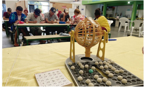
Bingo no dia 15 teve brindes doados pela comunidade araponguense

cia da luta da população em situação de rua. Além disso, a equipe especializada apresentou pontos importantes sobre o funcionamento, organização e estrutura do serviço socioassistencial. No último dia 15, foi realizado um bingo com a população em situação de rua e equipe. Houve a entrega de brindes doados pelos servidores e comunidade, entre eles, chocolates, bonês, tênis e mochilas. A programação da Semana da Luta da População em Situação de Rua do Centro Pop de Arapongas contará também com outras atividades, como apresentação de documentários e atividades