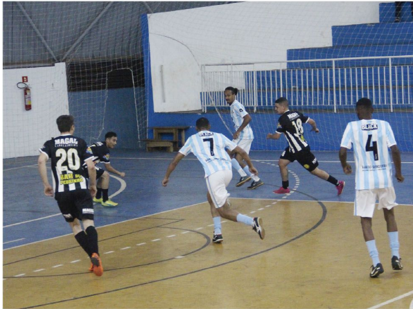
O time Gui Barbearia (azul e branco) venceu o Borússia por 3 a 1 nas quartas-de-final

■ Equipes Amigos do Xuxa/Emp. da Construção e Gui Barbearia já são semifinalistas; seus adversários sairiam da rodada de quinta à noite