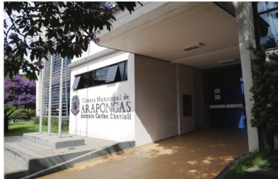
A Câmara Municipal de Arapongas

A Câmara Municipal de Arapongas aprovou, em duas votações, o programa CNH Cidadã, que concede a habilitação gratuitamente a jovens de baixa renda que se encaixarem nos critérios de seleção que serão definidos por meio de decreto do Poder Executivo. As votações pela aprovação foram unânimes – 14 votos a 0 – e realizadas nas sessões da segunda (07) e segunda (14). O projeto agora segue para a sanção do prefeito Sérgio Onofre.