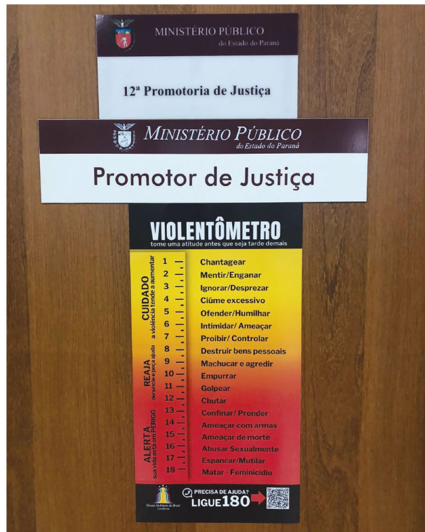
O objetivo da distribuição do Violentômetro é estimular, por parte de mulheres - e também de homens - uma reflexão a respeito de seu próprio relacionamento ou de alguém conhecido