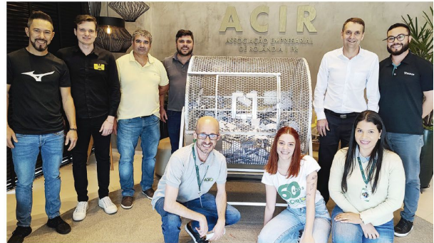
Os participantes do sorteio do Dia dos Pais na sede da ACIR

Até agora, já foi realizada a campanha do Dia das Mães, que premiou vencedores com kits de beleza, massagem relaxante e diversos produtos de beleza, e a campanha do Dia dos Pais. A próxima será o Dia das Crianças, e a grande campanha final do ano,