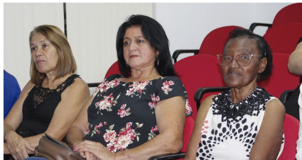
Moradoras do Josiane acompanharam a discussão e a votação do projeto de escrituração

Votação de escrituração de lotes movimentou a sessão de segunda