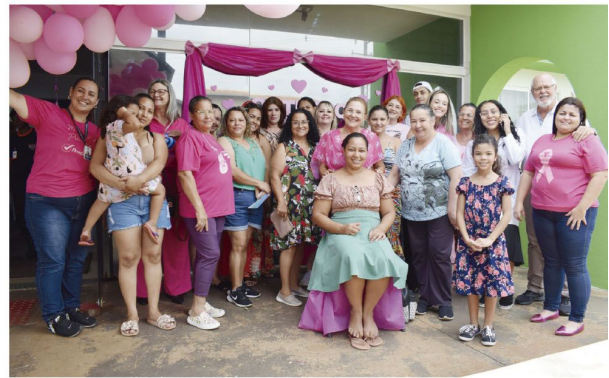
O 'bicho pegou' no sábado passado nas UBSs de Rolândia

É fundamental que as mulheres aproveitem este momento para cuidar de sua saúde e realizar os exames preventivos necessários. Empresas como White Like, JBS, Itamaraty, Internacional Couros, Vancouros, LAR, Eurofrol, Bioformula, Maxi Atacadista, Filpar, Santa Lúcia e Moinho Dias Branco já participaram ou têm coletas agendadas. Além disso, estão sendo realizadas palestras tanto nas igrejas quanto nas empresas, visando disseminar infor-