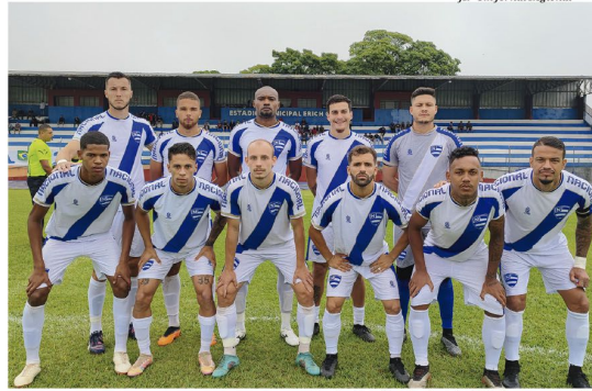
Derby Alemão: Nacional e REC fizeram um clássico equilibrado e, infelizmente, sem gols