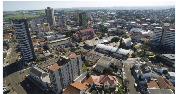
Visão aérea da região central de Cambé, onde pode-se ver a Igreja Matriz Santo Antônio

Para que todos pudessem acompanhar o desfile em segurança e com tranquilidade, algumas ruas foram interditadas a partir das 18 horas da quarta-fei-