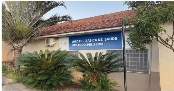
Obras na UBS do Bom Pastor começa no dia 16

■ Município tem quatro Unidades Básicas de Saúde que passarão por melhorias; obras começam no dia 16 deste mês