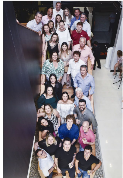
A 'família' Imobiliária Rolândia e a nova sede (abaixo)

A Imobiliária Rolândia sempre se pautou na coragem de ser pioneira, no acreditar no potencial inerente às famílias desta terra. Investimos com convicção, pois reconhecemos a capacidade de nosso povo. É essa confiança que