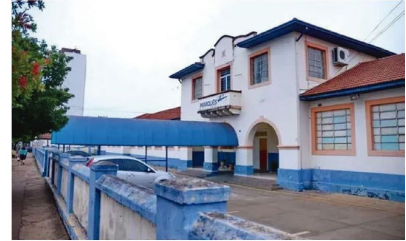
O colégio estadual Cívico-militar Marquês de Caravelas

"A Secretaria da Educação do Paraná (Seed-PR)