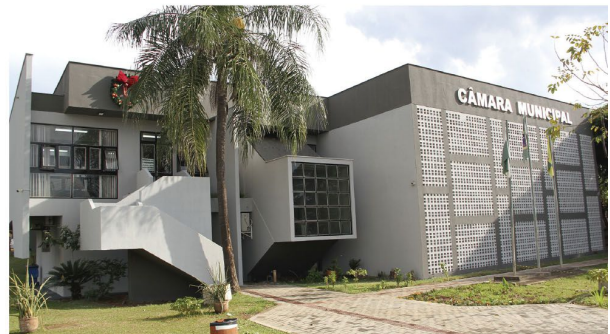
Próxima sessão é na segunda-feira, dia 16 de outubro

■ Sessão ordinária foi realizada na segunda-feira, dia 09 de outubro; próxima sessão é na segunda-feira (16)