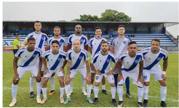
O Nacional continua líder do grupo B da Terceirona, isso desde a primeira rodada

O grupo A da Terceirona tem o Prudentópolis como líder com 8 pontos em 5