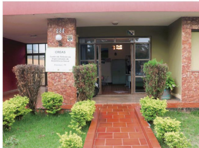
CREAS agora está na rua Pavão 284, na região central de Arapongas

A Prefeitura de Arapongas, por meio da Secretaria Municipal de Assistência Social (Semas), informa sobre o novo horário de atendimento dos Centros de Referência em Assistência Social (CRAS's) e também do Centro de Referência Especializado de Assistência Social (CREAS). Os locais passam a atender a população das 07h00 às 15h00 – sem intervalo (de segunda a sexta-feira).