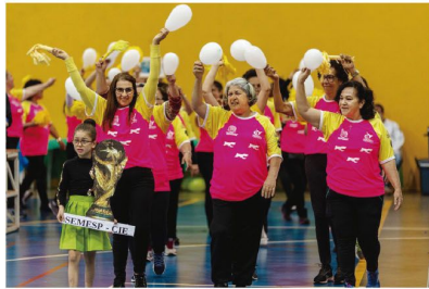
O JIA promove interação entre as pessoas idosas

A Prefeitura de Arapongas redefiniu a data de inauguração do Ginásio de Esportes do Conjunto Araucária (esquina das ruas Casaca de Couro e Bacurau Barrado) e também a abertura dos Jogos do Idoso (JIA) 2023. Os eventos serão realizados simultaneamente na quarta-feira (25), às 14h, com a presença de autoridades, idosos atendidos pelos serviços socioassistenciais e comunidade em geral.