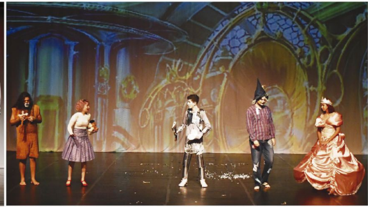
Acima, cenas das peças 'Centro de Reabilitação para Vilões' e 'O Mágico de Oz'

formado por professores e alunos do curso livre de teatro do Centro de Formação em Arte e Cultura (Cefac), e do Colégio Estadual Unidade Polo, que participam do projeto de descentralização. Nos finais de semana anteriores, o palco das encenações foi o Cine