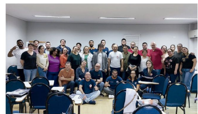
Ao todo, 32 profissionais, entre médicos e enfermeiros, estiveram no curso