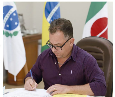
O prefeito de Cambé, Conrado Scheller, em seu gabinete

Cambé: prefeitura busca regularizar áreas de interesse social pág. 05