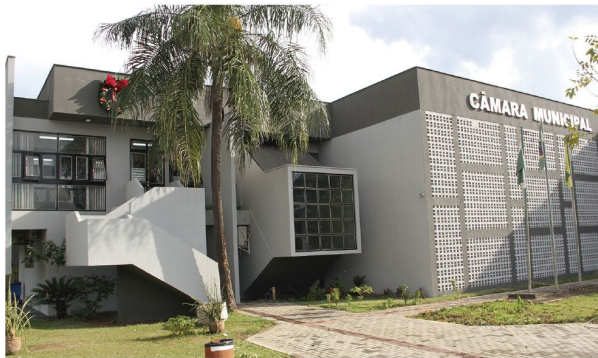
O prédio da Câmara Municipal de Ibiporã

■ Mudanças beneficiam servidores que atuam no Samu, UTS, técnicos de Raio X, Educador Social e Assistente Social