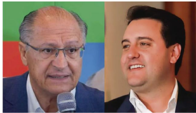
O vice-presidente Geraldo Alckmim e o governador Ratinho Júnior

“A entrega da expansão desse complexo é bastante significativa para os negócios da JBS e da Seara no Brasil e no mundo. Não