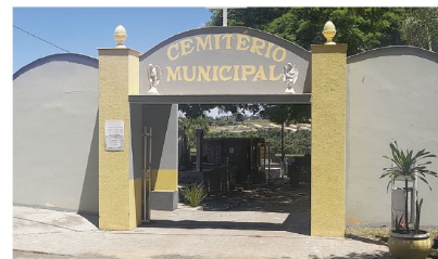
O cemitério municipal de Prado Ferreira

No município de Prado Ferreira, os serviços de melhoria nos túmulos podem ser realizados apenas até o sábado, dia 28 de outubro. A própria prefeitura fará a sua pintura até esse dia. Já no feriado de Finados, dia 02 de novembro, o cemitério municipal funciona das 07 horas até as 19 horas.