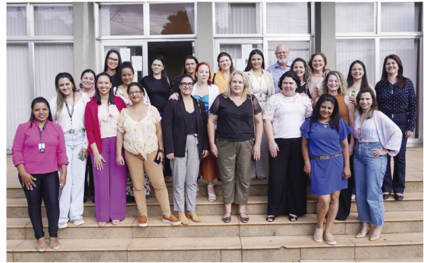
As conselheiras, representantes da Assistência, o prefeito e a primeira-dama, e a vereadora reunidos para a foto no dia da posse das membras do CMDM

Posse As membras do Conselho Municipal dos Direitos das Mulheres de Rolândia foram empossadas na sexta-feira (20) pelo prefeito