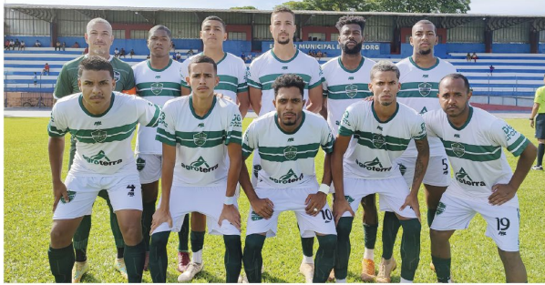
O Arapongas precisa vencer o ACP para continuar com chances na classificação

■ Rodada 8 (de 10) no grupo B tem CAC x Nacional em Cambé, Arapongas x ACP em Cornélio e REC x Portuguesa em Rolândia