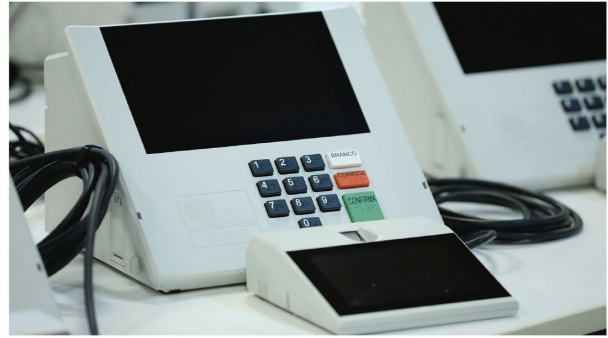
Muitos cartórios eleitorais receberam novas urnas a partir de maio