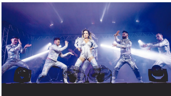
Apresentação do Café Society

■ Prefeitura organiza a tradicional Festa do Trabalhador com diversas atrações para toda a família