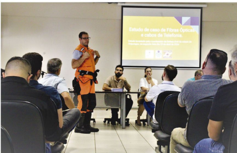
Reunião aconteceu na terça-feira no paço municipal

A Copel, empresa responsável por intermediar a relação com as operadoras e provedoras de serviços de internet e telefone, apresentou um relatório das ações da empresa. Ainda na reunião, um estudo de caso com tema 'Fibra Óptica