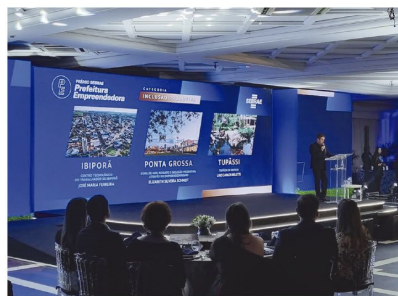
As cidades finalistas são anunciadas na cerimônia

crição até a premiação estadual. A jornada incluiu etapas como inscrição, habilitação, recurso, pré-seleção estadual, visita técnica e julgamento estadual. O projeto de Ibiporã está em um livro publicado e distribuído a todos os prefeitos participantes, destacando-se entre os 30 projetos: três finalistas das 10 categorias.