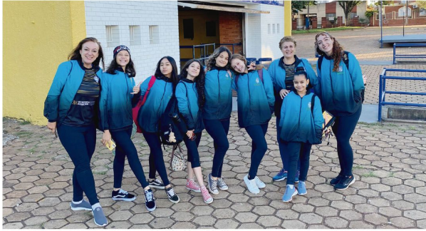
Equipe de Iporã brilhou em Arapongas

Alunas ibiporaenses são destaques na Copa Escolar do esporte, disputada em abril na Cidade dos Pássaros