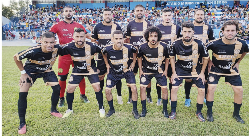
'Amigos do Xuxa/Bar do Paquinha' (acima) foi o time campeão do Torneio do Trabalhador 2024 em Rolândia; a equipe do Borússia (abaixo) ficou com o vice-campeonato

■ Equipe Amigos do Xuxa/Bar do Paquinha venceu o Borússia por 1 a 0 no estádio Erich Georg