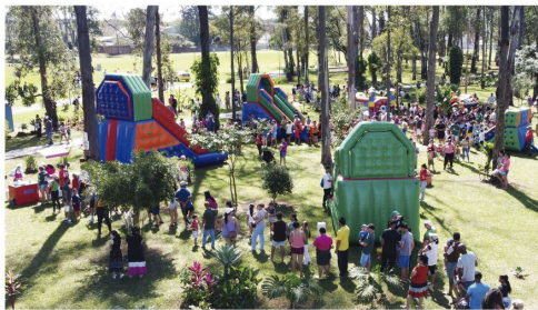
Muita gente foi até o Centro Esportivo Castelo Branco e viu o time do Strawbs ser campeão do Torneio do Trabalhador deste ano

A Festa do Trabalhador mobilizou a comunidade e contou com serviços públicos como o Ônibus da Saúde, da Secretaria Municipal da Saúde, com servidores de odontologia fazendo