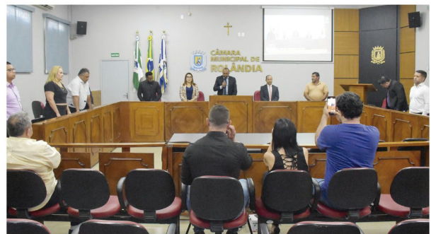
Os vereadores em pé antes da sessão de segunda-feira