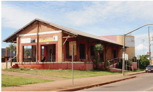
Local foi uma distribuidora de cimento na década de 1970 e, mais recentemente, uma lanchonete

Nos últimos meses, o prédio também passou a ser utilizado por indígenas como local de pernoite. "O primeiro passo foi solicitar a desocupação pelos índios, um trabalho que teve