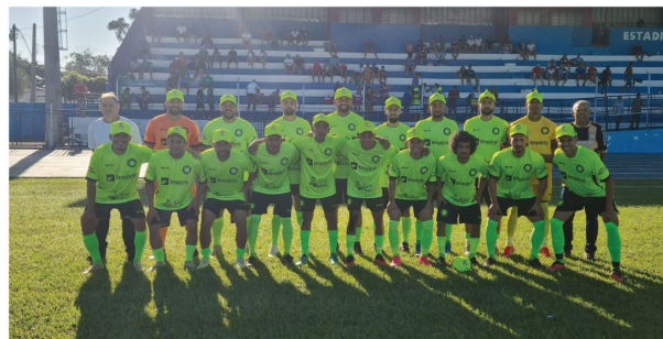
A Copa Amapar 2024 é disputada por 16 cidades da região e as equipes estão divididas em quatro grupos. No grupo A estão Pitangueiras, Florestópolis,

O Rolândia Futebol Clube tem como treinador o Xuxa, que foi campeão do Torneio 1º de Maio neste ano com a equipe 'Amigos do Xuxa/Bar do Paquinha'. Xuxa tem à disposição um elenco quase todo rolândense – há apenas um jogador de fora inscrito, mas que ainda não foi utilizado