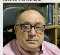
Formado em Teologia.

o nosso pecado foi desfeito com Cristo naquela cruz. Esse fato se torna verdadeiro para todos, os que crem. É possível que o "diabo" diga pra você que tudo isto não passa de uma conversa tola. No entanto, temos a palavra de Deus afirmando que: Sabendo isto: que foi crucificado com ele o nosso velho homem, para que o corpo do pecado seja destruído, e não sirvamos o pecado como escravos. Romanos 6:6. Amém!!