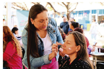
Clique da 1ª edição do 'Mãe é Show' no ano passado

mãe é Show também contará com ações integradas das Secretarias coligadas, além de outros parceiros.