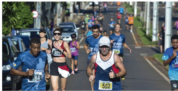
As crianças também participaram da prova em Ibioporã

■ A 22ª Prova Pedestre Adriana de Souza foi disputada em clima de festa e integração; conheça os campeões gerais