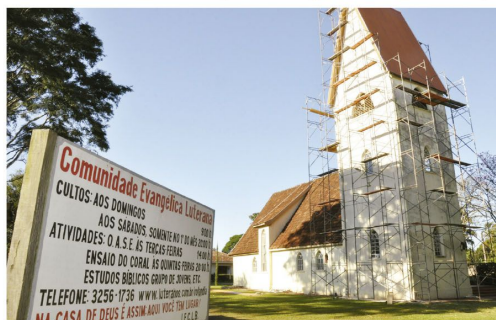
A Igreja Luterana de Rolândia durante a reforma de sua torre, em 2015. É lá que ficam os sinos Hoffnung, Liebe e Glauben (foto de 1954 do arquivo da Igreja Luterana)

Conforme a crença luterana, os sinos badalam para expressar solidariedade na dor, mas também convidam para o louvor e a gratidão. A ação da sexta-feira teve como objetivo lembrar daqueles que, na