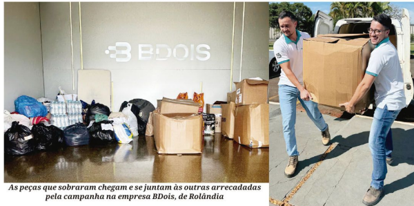
As peças que sobram chegaram e se juntam às outras arrecadadas pela campanha na empresa BDOIS, de Rolândia

■ Produtos que não foram vendidos no Bazar do São Rafael, na Agrofest, se juntaram à campanha de arrecadação da BDOIS em prol dos gaúchos