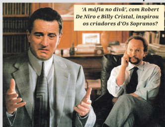
'A máfia no divã', com Robert De Niro e Billy Cristal, inspirou os criadores d'Os Sopranos?

- À espera de um milagre: Numa das melhores adaptações de Stephen King esse drama de cadeia que se passa nos anos 20, mostra um cara gigantesco acusado de assassinar duas meninas e vai pro corredor da morte. O filme vai mostrando o dia a dia nesse peculiar lugar onde misturam-se assassinos, malucos e policiais num equilíbrio ténue de paz. O cara gigante? É muito, muito mais do que aparenta, e vai te emo-