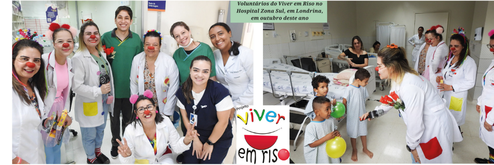
Voluntários do Viver em Riso no Hospital Zona Sul, em Londrina, em outubro deste ano

A edição deste ano em Cambé incluiu a distribuição de brinquedos novos ou em bom estado, arrecadados por