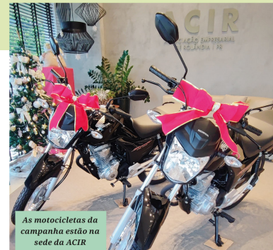
As motocicletas da campanha estão na sede da ACIR

Contando com as motos, a campanha sorteará um total de 28 prêmios, que incluem: duas fritadeiras, dois liquidificadores, um