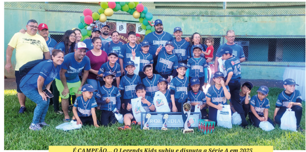
É CAMPEÃO... O Legends Kids subiu e disputa a Série A em 2025