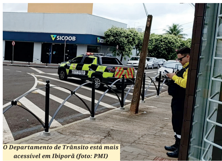
O Departamento de Trânsito está mais acessível em Ibiporã

O Departamento de Trânsito esclarece ainda que, para assuntos diversos, a população continuará podendo contar com a Central de Atendimento através do número 43 3178-8490. A implementação do WhatsApp é mais uma estratégia da