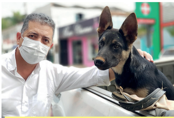
O CastraPet em Rolândia é um trabalho do deputado estadual Cobra Repórter (foto de 2021)

O Programa Permanente de Esterilização de Cães e Gatos, promovido pela Secretaria de Estado do Desenvolvimento Sustentável (Sedest), em parceria com a Prefeitura de Rolândia e com a Secretaria de Agricultura e Meio Ambiente, busca o controle populacional de cães e gatos e a prevenção de zoonoses. A ação conta com apoio do deputado estadual Cobra Repórter. Mais informações pelo FoneWhats (43) 3156-0333.