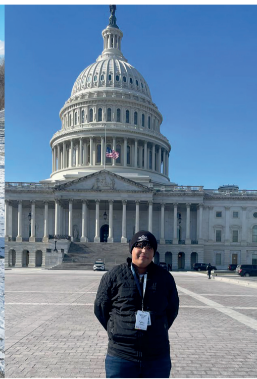
Kawan nos EUA e também em frente ao Capitólio, em Washington D.C.

Abaixo, leia o QR Code e conheça o projeto 'Cultiva'