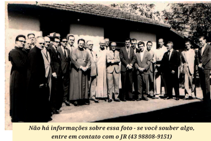
Não há informações sobre essa foto - se você souber algo, entre em contato com o JR (43 98808-9151)