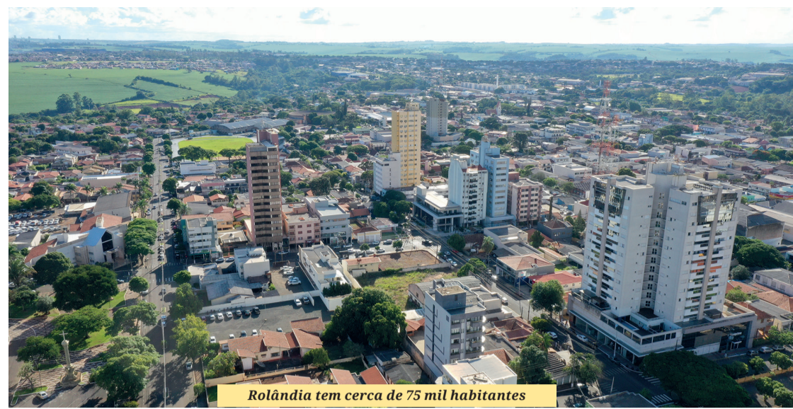
Rolândia tem cerca de 75 mil habitantes

“Isso mostra que as empresas estão acreditando no nosso município, investindo e ampliando as