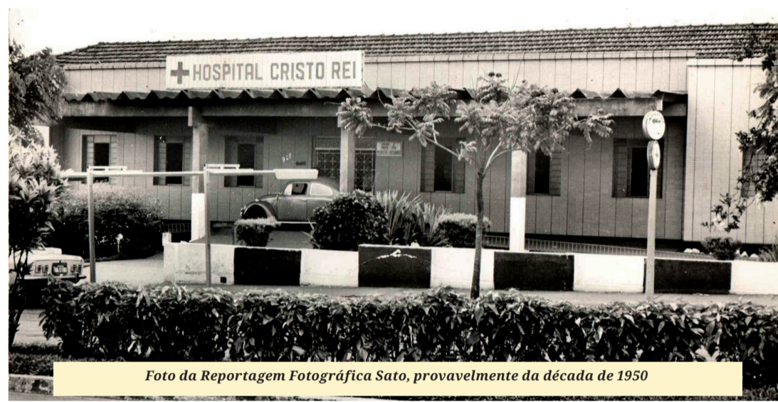
Foto da Reportagem Fotográfica Sato, provavelmente da década de 1950

Além de Ibiporã, o Hospital Cristo Rei atende à população dos municípios de Jataizinho, Alvorada do Sul, Primeiro de Maio, As-