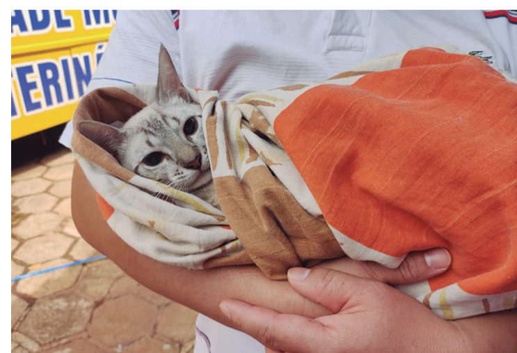
Gatinha castrada em 2022 pelo CastraPet em Rolândia

O caso é que essa castração dos 408 pets já foi agendada e todas as vagas para esta ação já foram preenchidas. Acontece que, como em vezes passadas, muita gente faz a inscrição e termina por não levar seu pet, deixando a vaga vazia. O