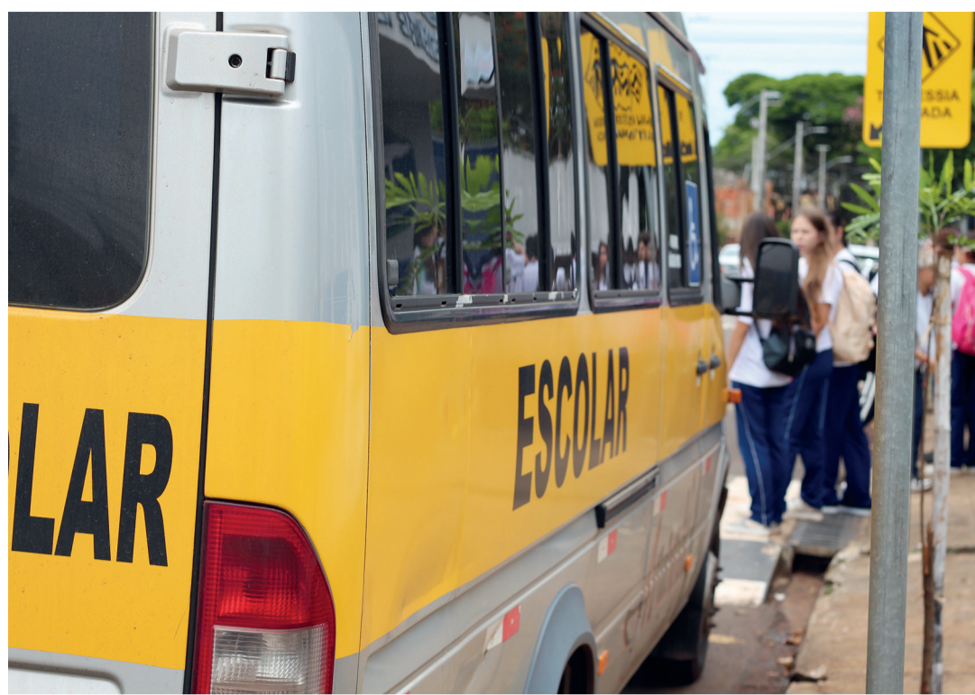
Van escolar aguarda pela saída dos alunos no Colégio E.C.M. John Kennedy, em Rolândia

As pessoas que quiserem conferir se o prestador de serviço está regular ou fazer alguma denúncia, basta mandar uma mensagem para o WhatsApp da Prefeitura de Rolândia, que é o (43) 3255-8600. Nesse número, basta escolher a opção 'Secretaria de Finanças' e, em seguida, 'Fiscalização/denúncias'.