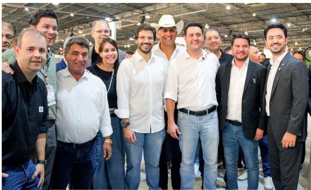
Ratinho (à frente, 3º à dir.) com autoridades regionais e federais

"O Paraná é o estado que mais produz derivados de madeira de reflorestamento, incluindo os setores moveleiro e de celulose. Isso gera muitos empregos e fortalece a economia regional", afirmou o governador Ratinho, destacando o papel de Araçongas no setor moveleiro.