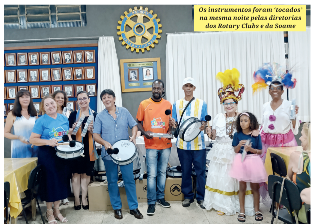
Os instrumentos foram 'tocados' na mesma noite pelas diretorias dos Rotary Clubs e da Soame