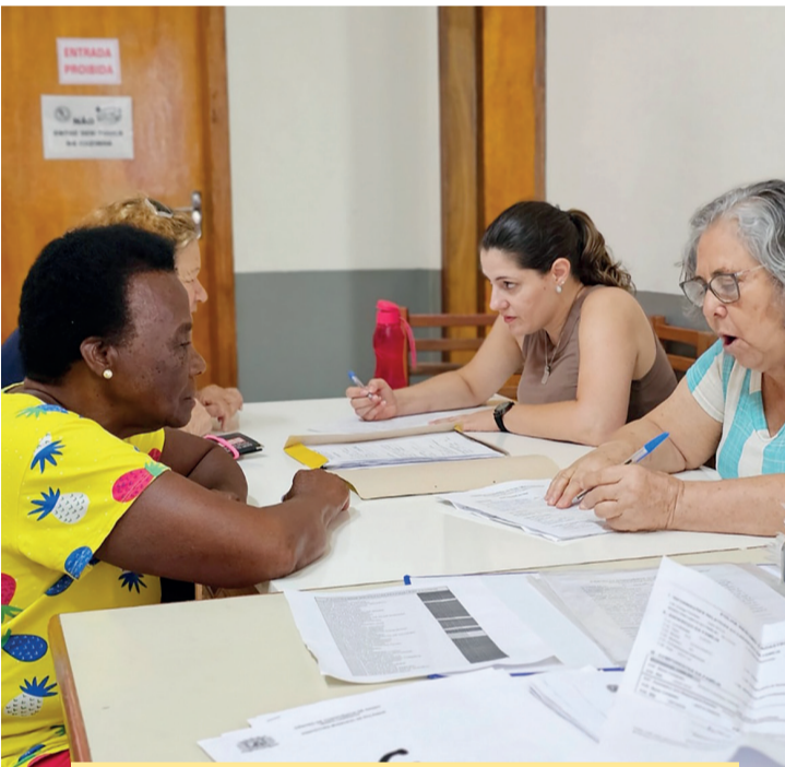
Idosa faz seu recadastramento em Rolândia

A secretaria de Assistência Social de Rolândia iniciou o recadastramento de idosos e idosas que são usuários do Centro de Convivência dos Idosos (CCI). Se a pessoa tem 60 anos ou mais e ainda não participa, basta ir até o CCI e fazer o seu cadastro. O Centro de Convivência dos Idosos de Rolândia fica na Rua Antônio Campaner, 177, no conjunto Domingos Neves, e atende das 13 às 16 horas. O cadastro ou o recadastramento também pode ser feito em dos três CRAS do município (Vila Oliveira, San Fernando ou Nobre). Basta levar os documentos pessoais e um comprovante de residência.