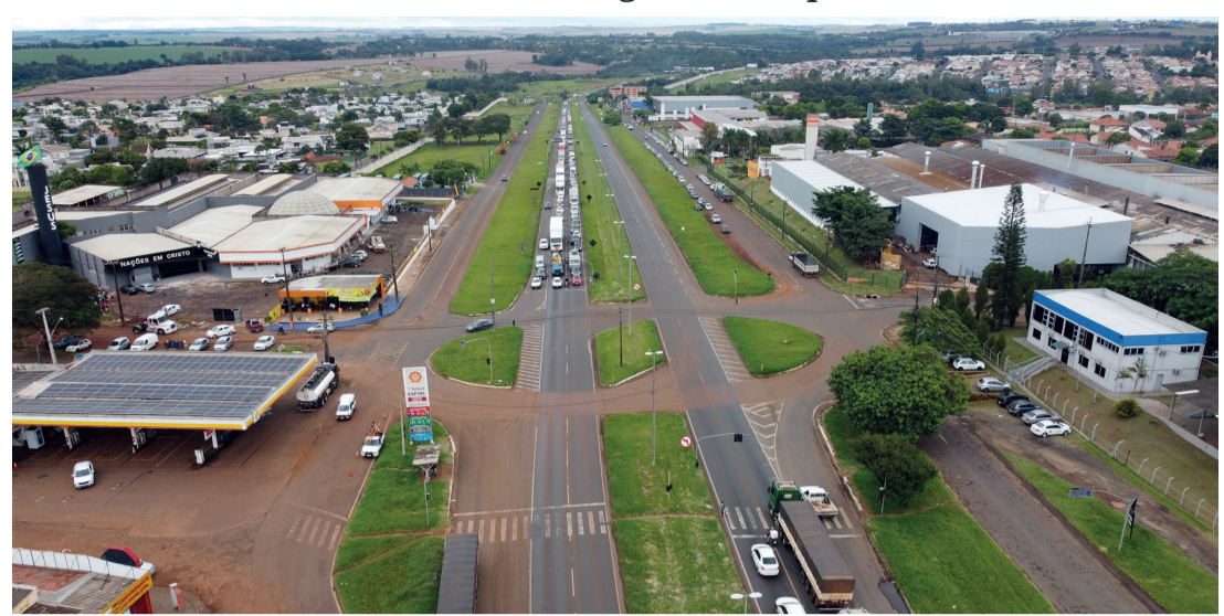
Cerca de 25 mil veículos e seis mil caminhões trafegam pelo trecho diariamente

■ Órgão federal também liberou a construção do Viaduto da Esperança; comunicado, Governo do Estado segue com o processo licitatório