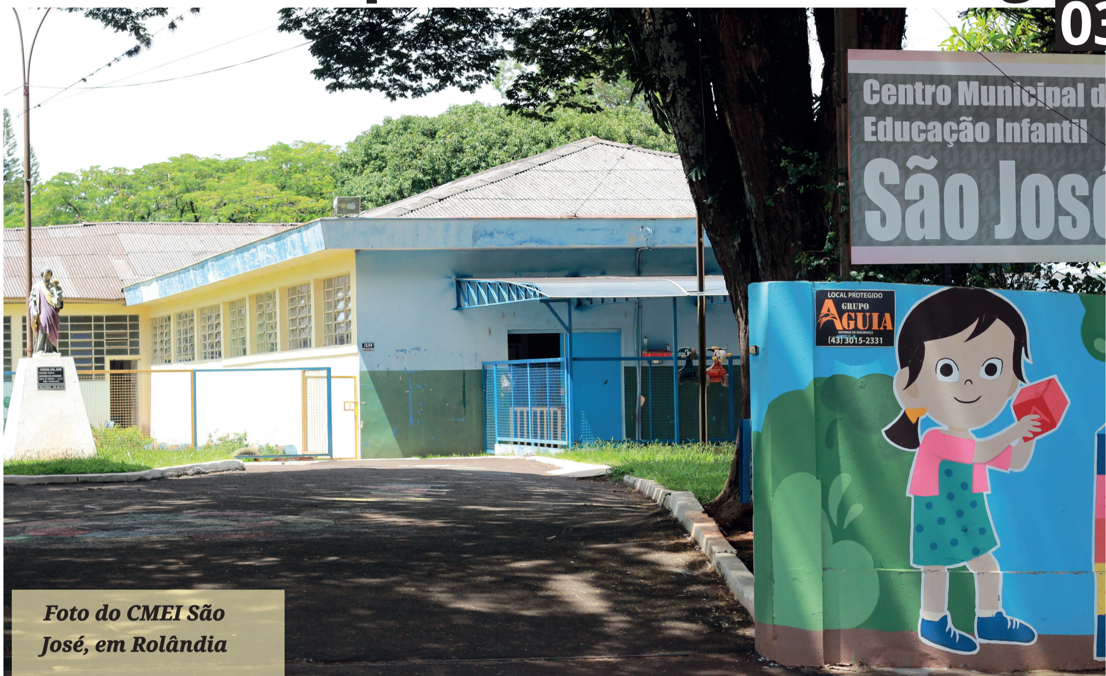
Foto do CMEI São José, em Rolândia

Ibiporã: OS de projeto de importante obra é assinada - 04