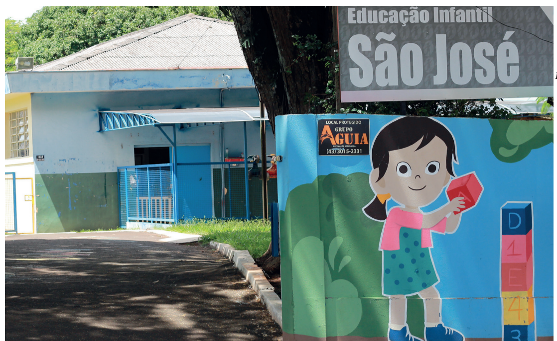
O Centro Municipal de Educação Infantil São José, de Rolândia