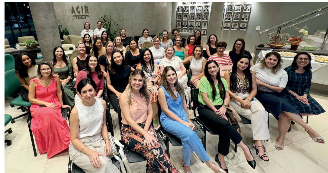
Todas as participantes da primeira reunião do ano da ACIR Mulher

Ambos núcleos são uma excelente oportunidade para empreendedores que desejam expandir seus horizontes profissionais, aumentar suas conexões e contribuir para o desenvolvimento de Rolândia e região. Saiba mais sobre a ACIR Mulher no perfil @acirmulherrolandia do Instagram, sobre o ACIR Jovem no Instagram perfil @acirjovem do Instagram. Outras informações sobre como se tornar um membro também podem ser obtidas pelo FoneWhats (43) 3256-1063.