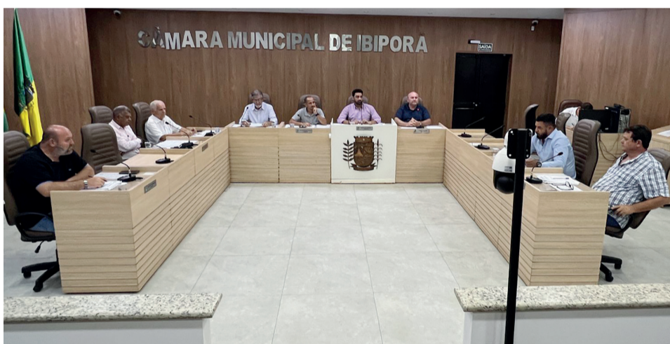
Momento da sessão da segunda-feira (10)

que passará a ter a Diretor-Presidente, Diretor Administrativo e Financeiro, Diretor Técnico Operacional, Diretor de Saneamento, Assessor de Comunicação Social e Assessor de Gabinete do Diretor-Presidente. Também haverá alteração na Tabela de Função Gratificada, no Símbolo FG2, com o acréscimo de mais três vagas. Segundo o Executivo, o impacto financeiro anual, com as modificações, será de R$ 84.007,20. O PLS 002 mostra a cria-