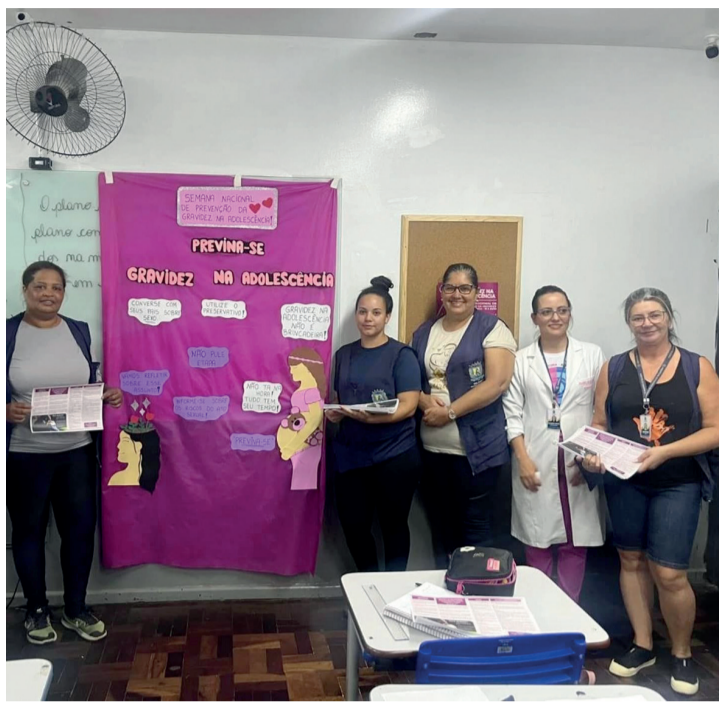
Equipe da UBS Parigot no colégio José Herions

Durante o mês, são realizadas palestras nas salas de aula e distribuídos panfletos educativos sobre os riscos e as consequências da gravidez precoce, com o objetivo de conscientizar os adolescentes sobre a importância da prevenção e do cuidado com a saúde.