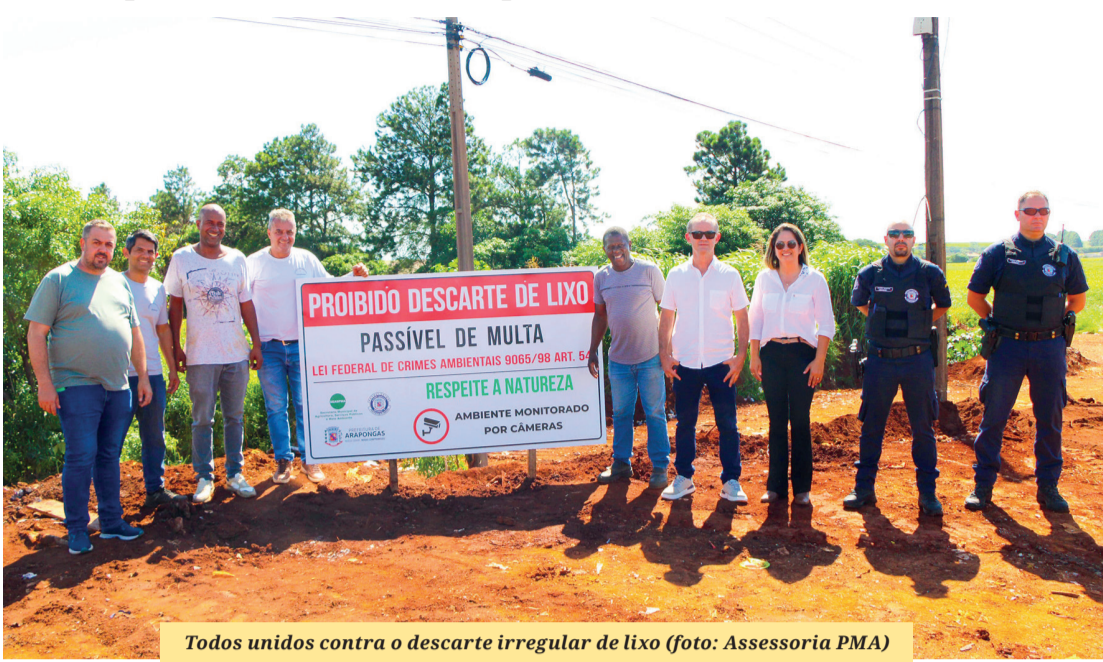
Todos unidos contra o descarte irregular de lixo

■ Prefeitura passa a monitorar descarte de lixo às margens da via e descumprimento de medida implicará em multa de crime ambiental