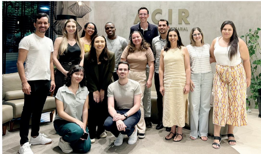
A primeira reunião da ACIR Jovem foi realizada na sede da ACIR

Durante o encontro, foram apresentados o histórico da ACIR Jovem, sua atuação ao longo dos últimos 10 anos e a contribuição do grupo para o fortalecimento do associativismo na região. Os participantes também tiveram a oportunidade de entender o papel da ACIR, entidade que soma 62 anos de apoio ao de-