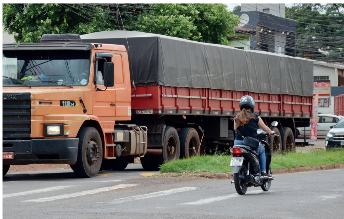
Carreta no trânsito urbano de Rolândia na manhã da quinta-feira

Já a Vila Oliveira teria o Estacionamento Rotativo na rua Sagaragi até a rua Iracema, e nas ruas Iracema, Reinaldo Massi, To-