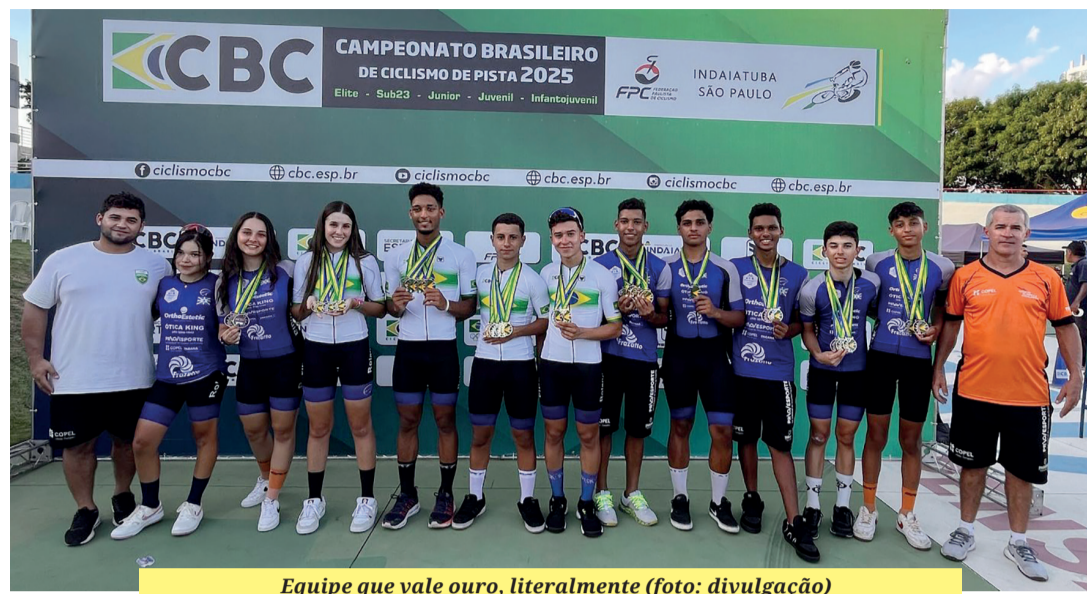
Equipe que vale ouro, literalmente

■ Equipe rolandense ganhou 29 medalhas do Brasileiro de Base disputado em Indaiatuba; seis atletas disputam a Elite até domingo