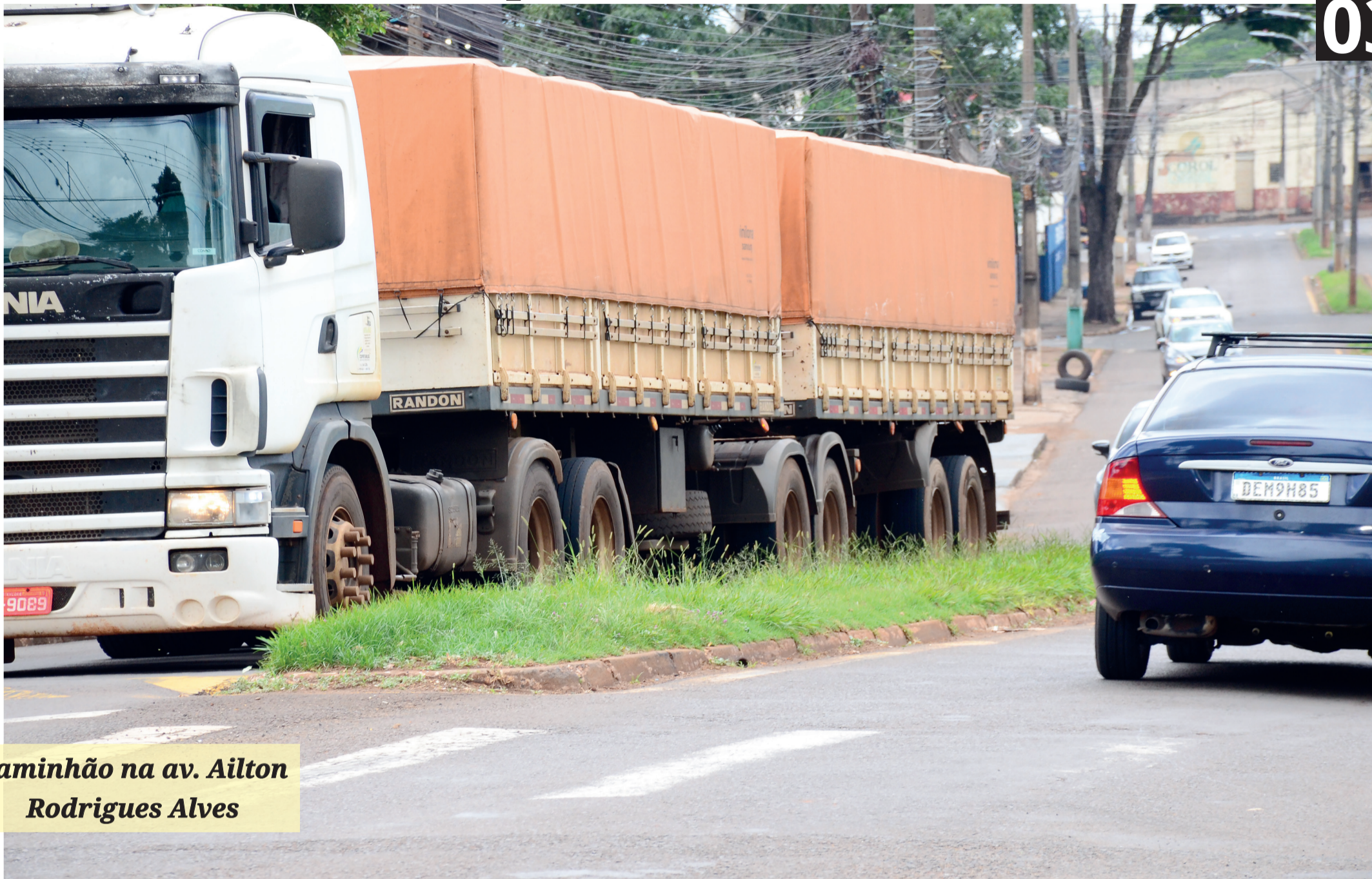
Caminhão na av. Ailton Rodrigues Alves

Ibiporã discutiu sua Saúde pros próximos quatro anos - 04