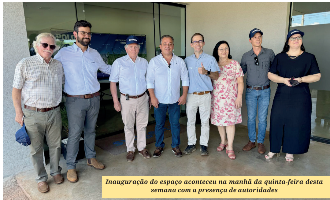
Inauguração do espaço aconteceu na manhã da quinta-feira desta semana com a presença de autoridades

■ Empresa de tecnologia e inovação agrícola, a multinacional Syngenta montou o seu maior polo tecnológico estadual no município