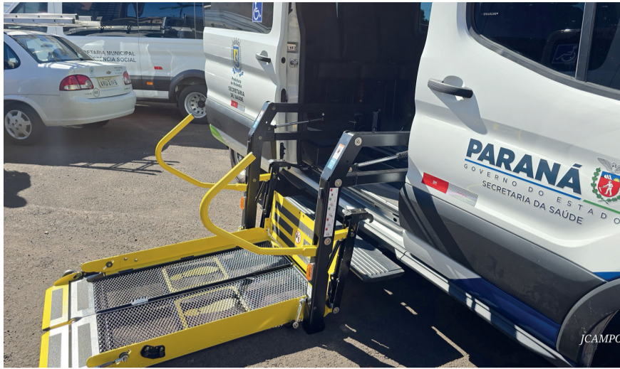
As vans foram adquiridas por emendas do deputado estadual Cobra Repórter e do deputado federal Marco Brasil, além da contrapartida da prefeitura

■ Veículos irão reforçar o transporte de pacientes nos distritos de São Martinho e Bartira