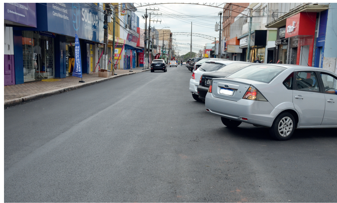
Trecho central da Interv. Manoel Ribas terá pinturas de vagas já para o Estacionamento Rotativo