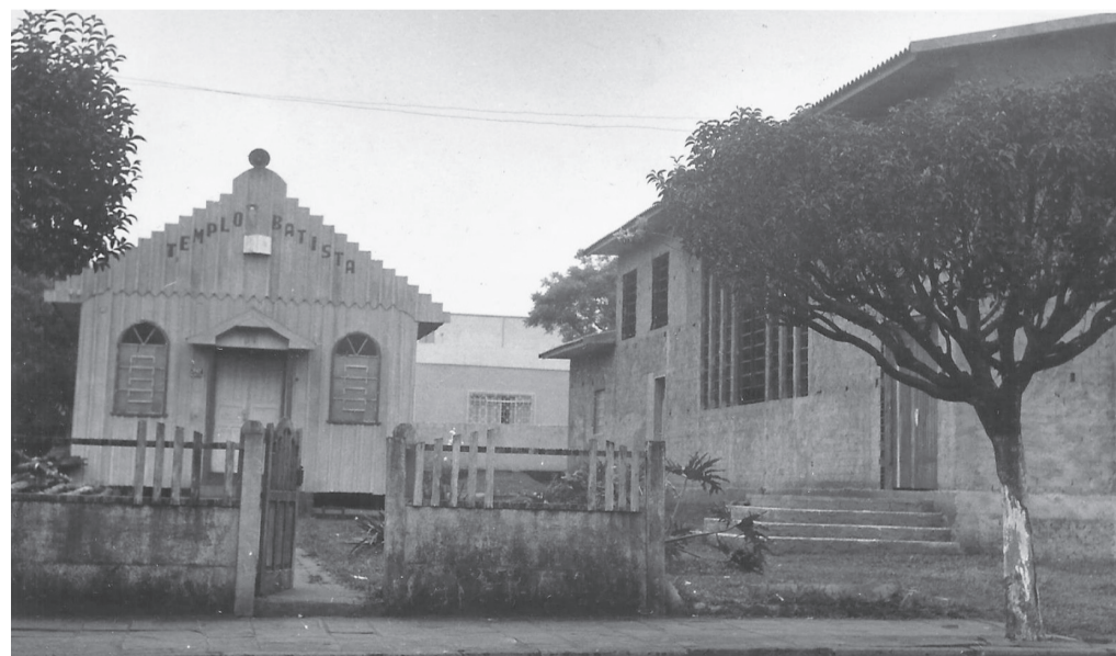
O atual templo da PIB sendo construído na década de 1940

JR @umjornalregional /UmJornalregional umjornalregional.com.br jornalderolandia1@gmail.com