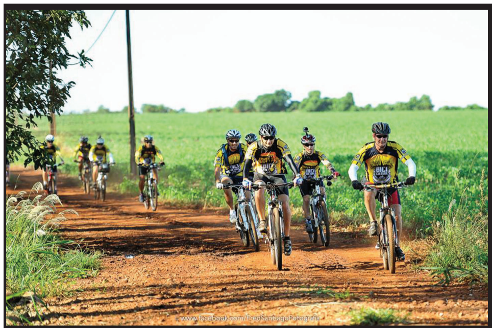
Foto de 3º 'Caminhos de São José', em 2015

■ Passeio ciclístico de Rolândia começou em 2013 e não foi realizado apenas em 2020 e 2021 por conta da Covid-19