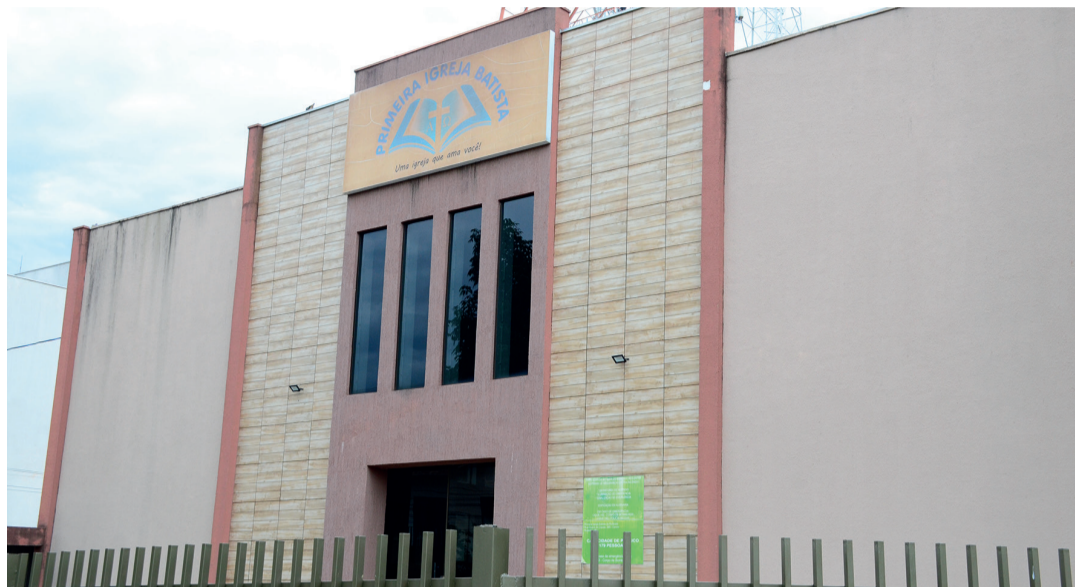
A PIB de Rolândia está quase octagenária