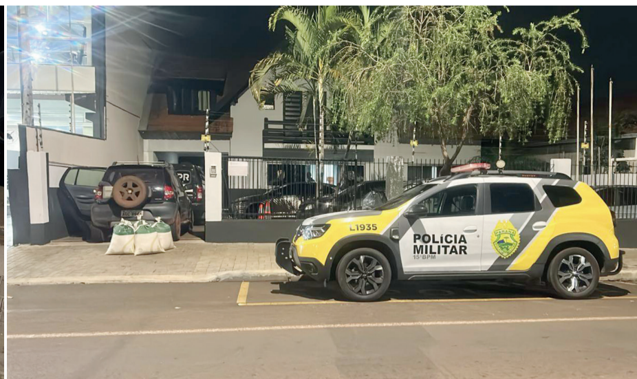
O veículo, os produtos e as mulheres foram trazidas para a delegacia de Rolândia