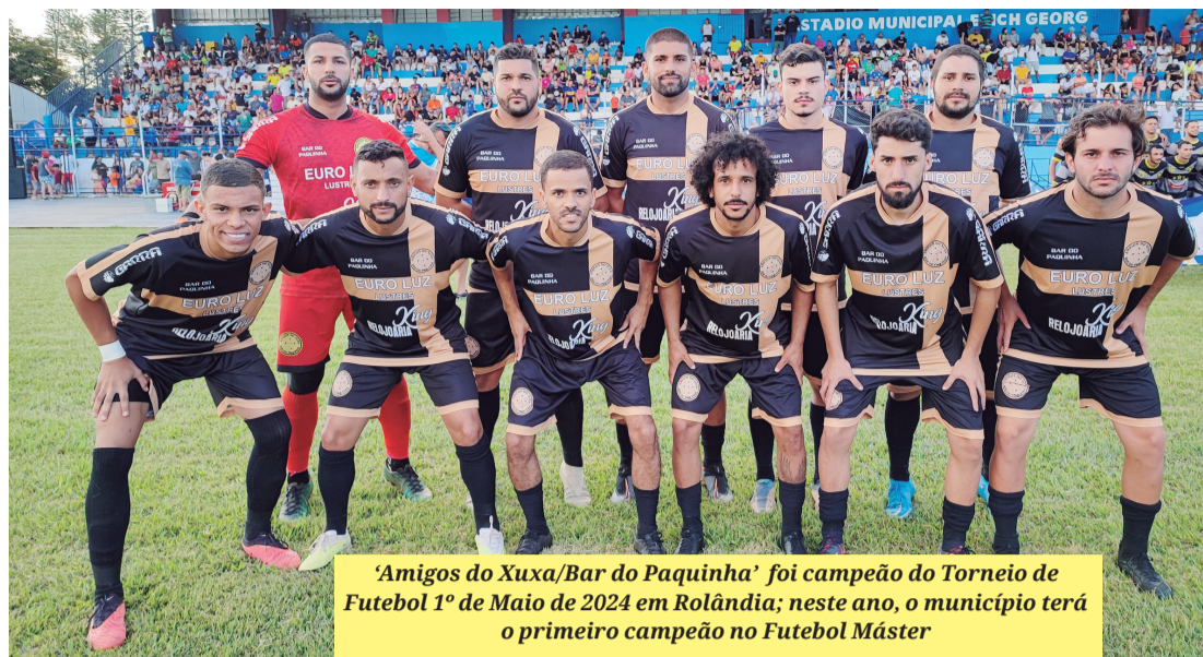
'Amigos do Xuxa/Bar do Paquinha' foi campeão do Torneio de Futebol 1º de Maio de 2024 em Rolândia; neste ano, o município terá o primeiro campeão no Futebol Máster

■ Inscrições para os torneios de Futebol (categoria livre), Futebol máster e Vôlei de areia, masculino e feminino, vão até dia 24 de março