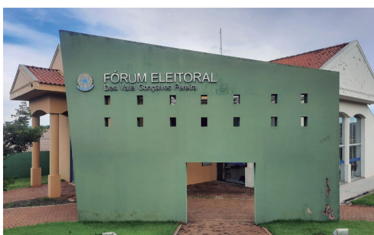
O Fórum Eleitoral de Rolândia

A lista dos eleitores em débito com a Justiça Eleitoral deve estar afixada no cartório eleitoral e pode