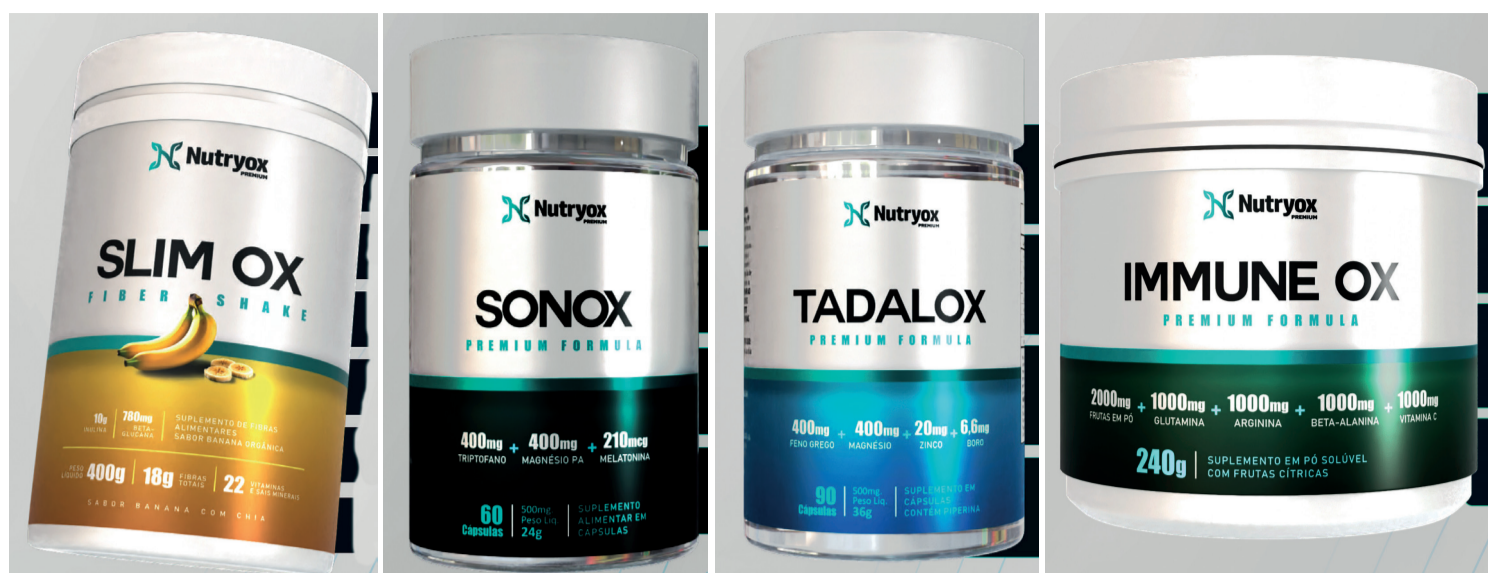
Os produtos da Nutryox Premium são regulamentados pela Anvisa

O Tadalox é outro suplemento alimentar da Nutryox que vem conquistando cada vez mais as pessoas. Esse produto induz a um au-