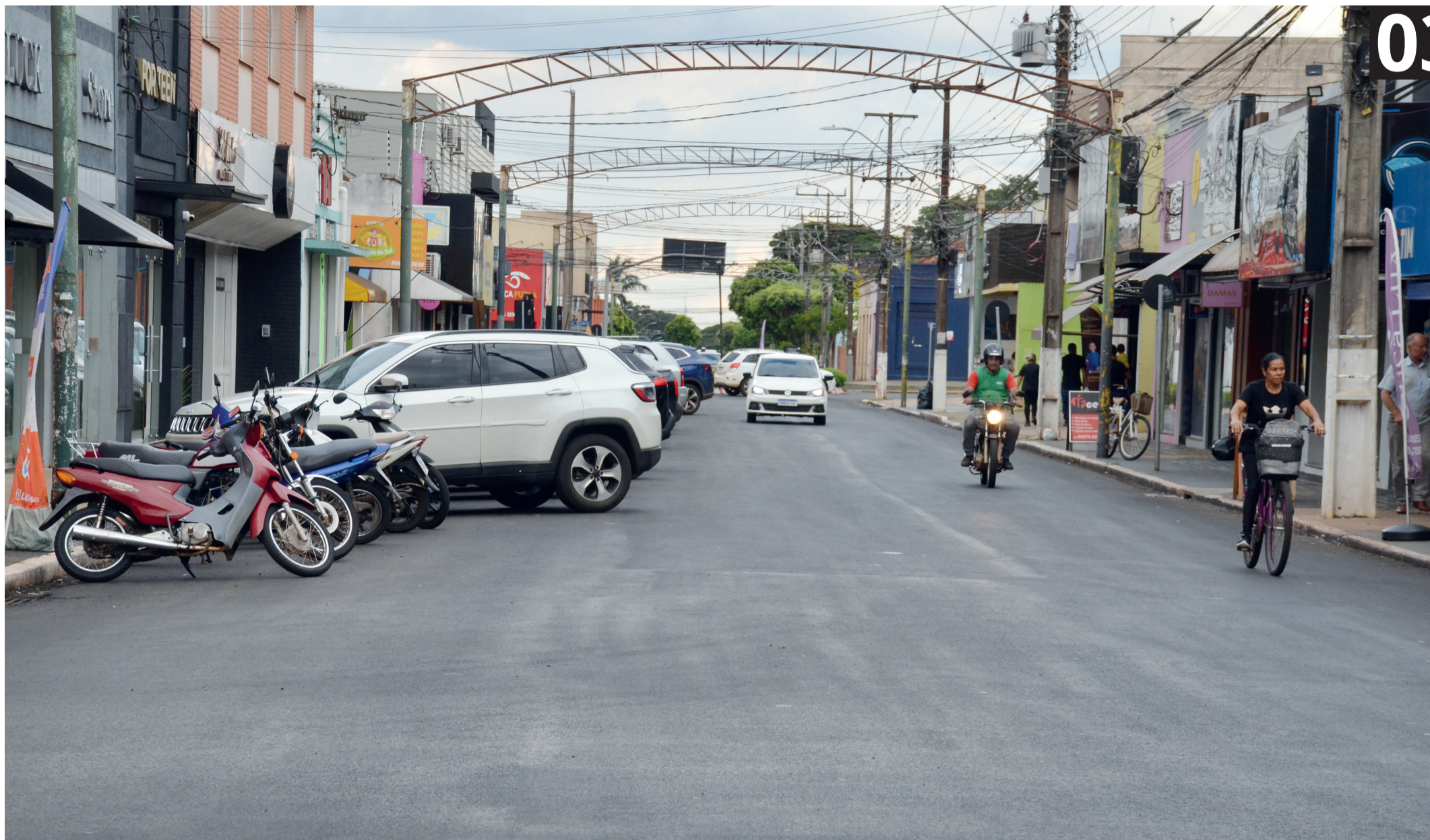
Trecho central da Interv. Manoel Ribas receberá pinturas de vagas já para a Zona Azul

Ibiporã: servidores tem formação humanizadora - 04