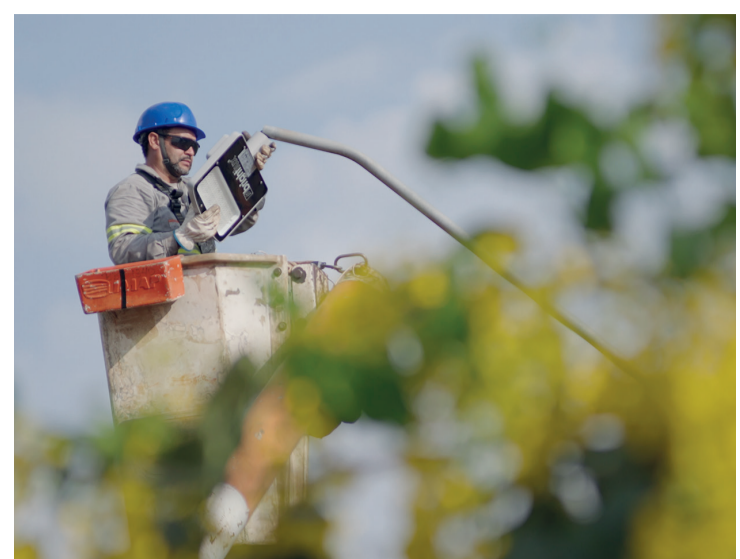
Investimento de R$ 7 milhões em iluminação ornamental

"Esse é um investimento em mais segurança, qualidade de vida e para dar ao