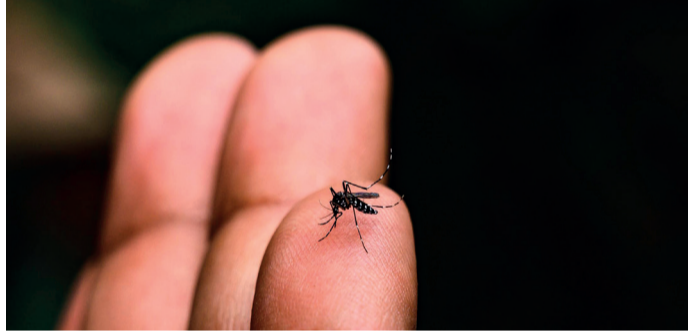
De olho no Aedes, que transmite a dengue e outras doenças

“Infelizmente estamos registrando esta morte, sendo o primeiro óbito que será contabilizado no boletim epidemiológico que emitimos ainda nesta terça (01).