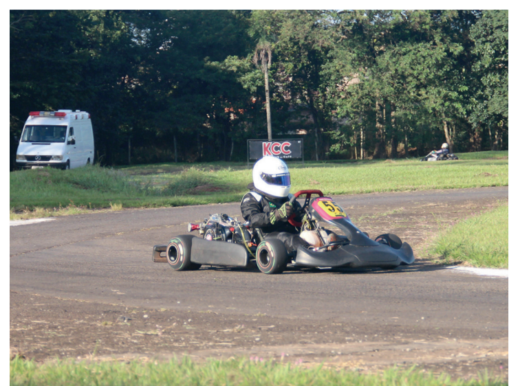
Uma foto de 2018 e outra da década de 1970

O presidente do KCC repassou a programação para o final de semana de velocidade no kartódromo de Rolândia. “Os treinos livres serão no sábado. No domingo, o abastecimento é as 10 horas, seguido do warmup (aquecimento) às 10h30. A tomada de tempo começa às 11 horas com a 1ª bateria marcada para começar às 13 horas e, a