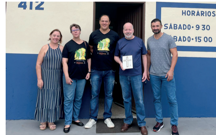
Membros da Luterana entregam a doação ao presidente da Casa da Sopa

Recursos doados são parte de uma promoção realizada pela Luterana; doação foi feita no dia em que a Igreja completou 89 anos