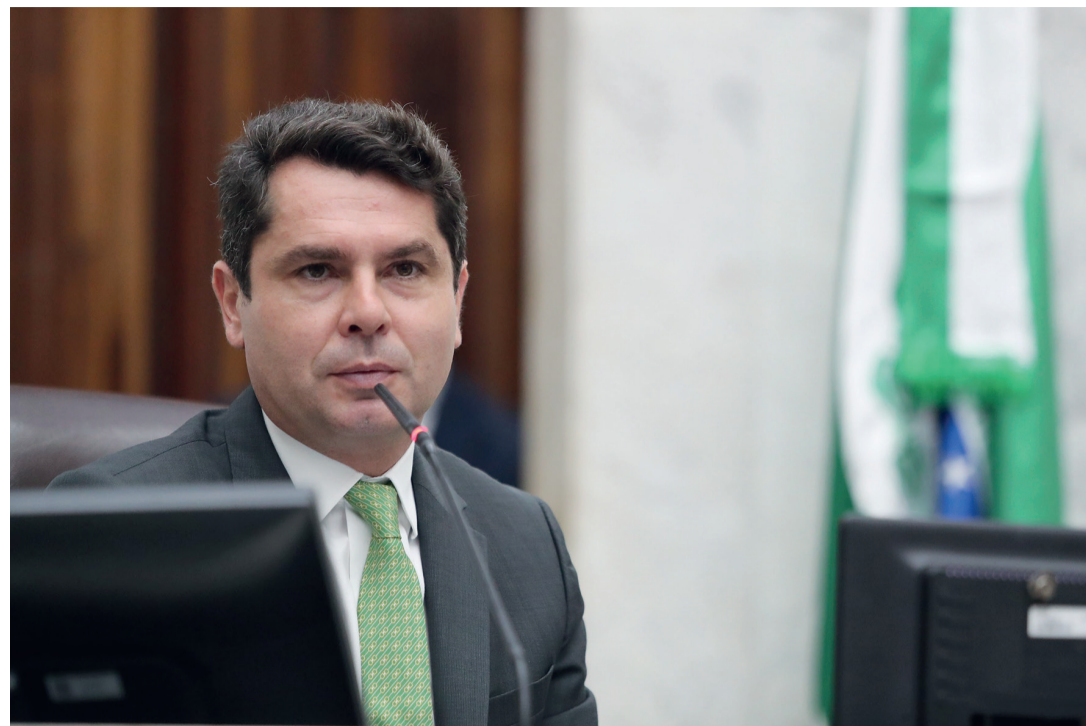
O presidente da Assembleia Legislativa do Paraná, Alexandre Curi

As vagas do CNH Social serão divididas em quatro