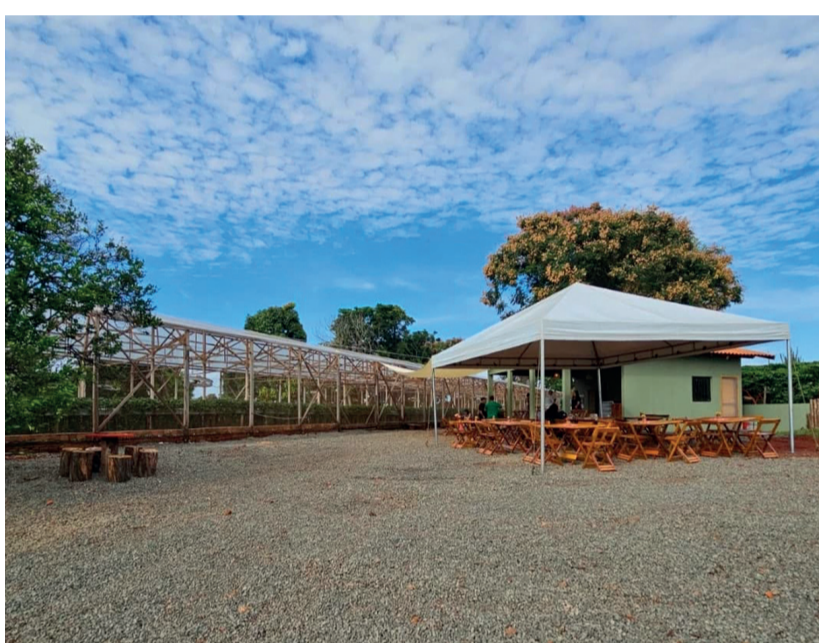
Café Rural Navarro, tranquilidade entre plantações de morango e de café; ao lado, a família Navarro se confunde à plantação

Café começa a atender neste sábado no distrito do Bartira, em Rolândia, e oferece colheita de morangos sem agrotóxicos, cardápio com produtos da roça e experiências inéditas no campo