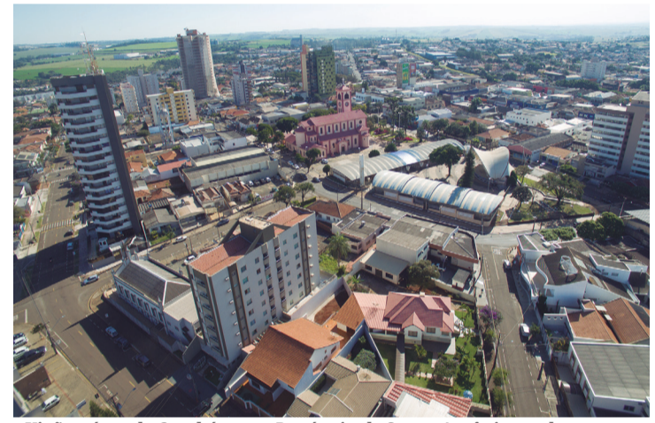
Visão aérea de Cambé com a Paróquia de Santo Antônio em destaque