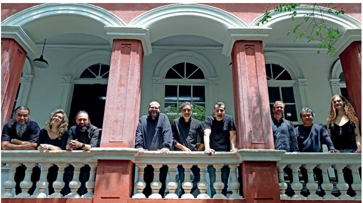
A Orquestra à base de Corda

Desenvolvido pela Gerência de Cultura do Sesi e realizado pelo Sesi Cultura PR, o projeto Sesi Música promove apresentações com o objetivo de difundir a cultura musical, formar plateias e fomentar a produção artística no Paraná e no Brasil. A iniciativa valoriza o encontro criativo entre artistas, aproximando o público de nomes consagrados nacional e internacionalmente e revelando intérpretes e compositores da cena musical paranaense.