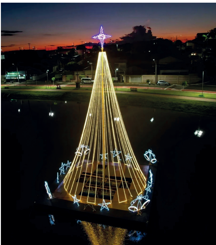
Decoração e iluminação noturna neste ano no lago Dom Pedro Zilli

Devido à programação natalina, a Praça Pio XII vai contar com Praça de