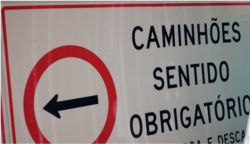
Placas serão instaladas tão logo a lei seja aprovada e sancionada

As operações de carga e descarga de mercadorias no perímetro urbano, para veículos restritos pela Lei, deverão ter uma Autorização Pontual de Carga e Descarga, solicitada com antecedência mínima de 24 horas na Sestran. Essa autorização indicará o horário permitido para a operação, que preferencialmente deverá ocorrer entre as 22 horas e as 07 horas ou em horários de menor movimento diurno a serem definidos pela Secretaria.