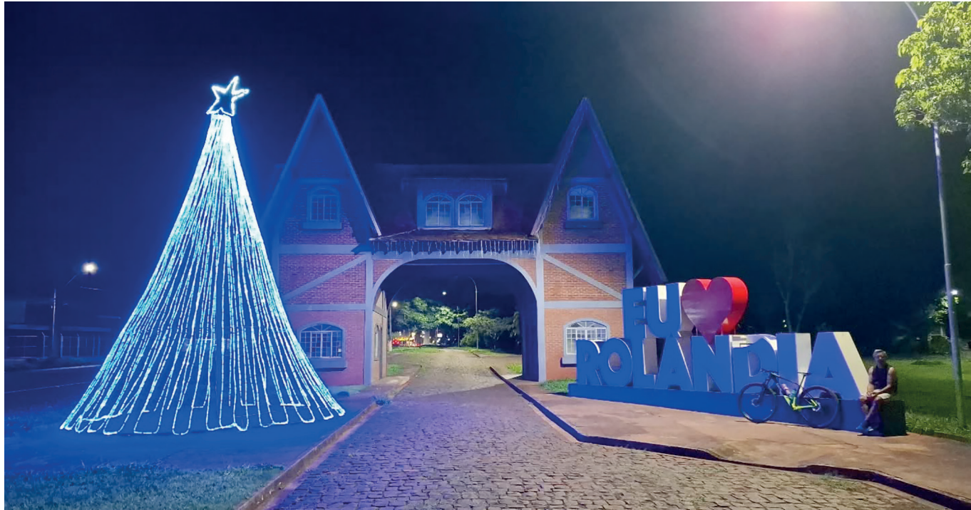
Decoração Natalina está espalhada por toda a cidade e pelos distritos

■ Evento de lançamento do Natal teve a chegada do Papai Noel, acendimento da decoração natalina e várias apresentações