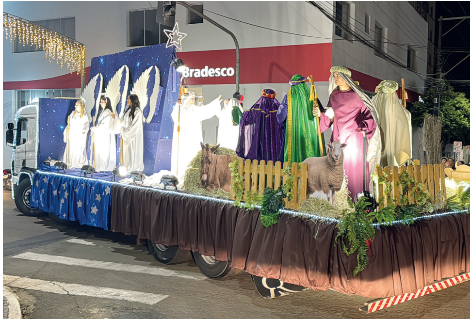
O ‘passeio’ do Presépio Vivo no ano passado e parte da fachada da Igreja Matriz São José e o evangelista João em primeiro plano

Os três dias da ‘Natal Fest’ prometem emocionar quem assistir aos eventos e ações programadas. No sábado (20) e no domingo (21), o Auto de Natal será apresentado, a partir das 19h30, em um palco montado na rua Santa Catarina, entre a lateral da Igreja e a Secretaria Paroquial. Essa história do Natal será contada com músicas, narrações e representações: