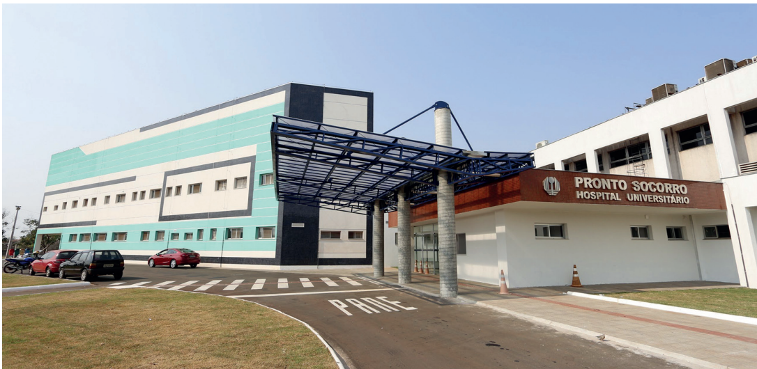
O HU emitiu uma nota, alertando para os possíveis golpes