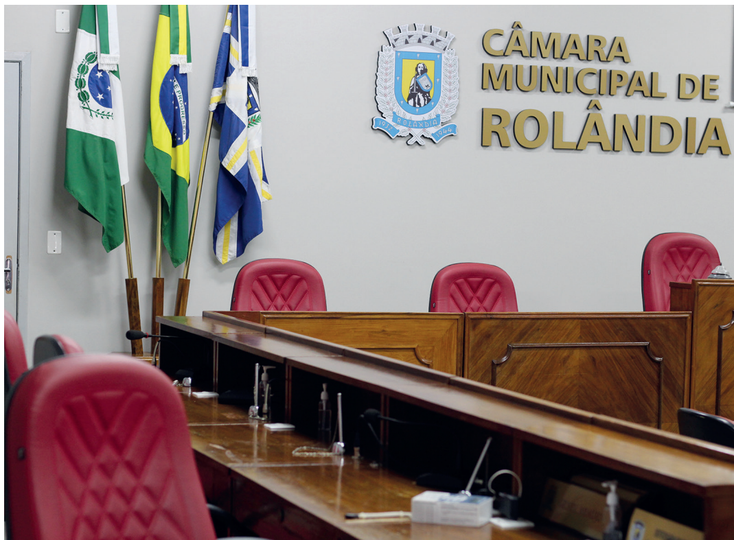
Câmara de Rolândia terá de ‘comprar’ mais uma cadeira para 2029

Como foi aprovada a proposta à emenda, Rolândia teve seis Legislaturas com 10 cadeiras – de 2005-2008 a 2025-2028.