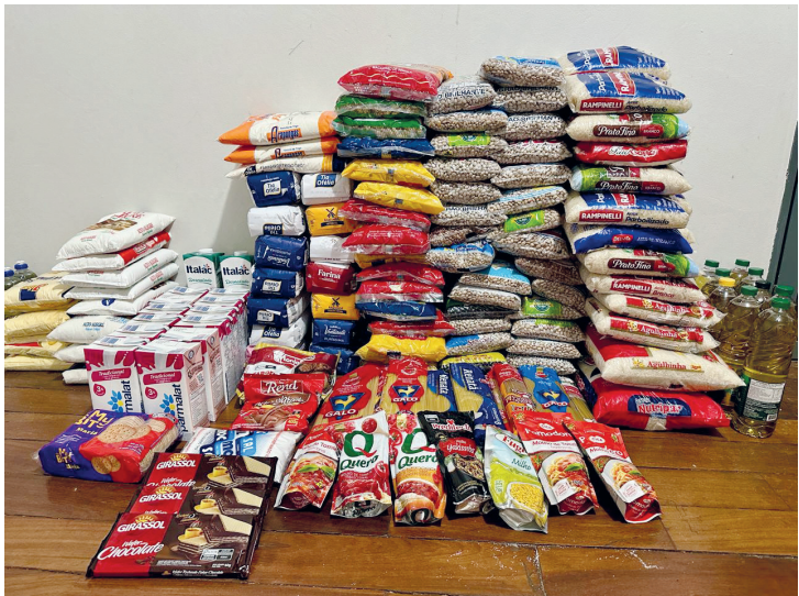
O alimento arrecadado durante o evento

■ ‘Natal que Alimenta’ arrecada produtos para famílias vulneráveis em Rolândia