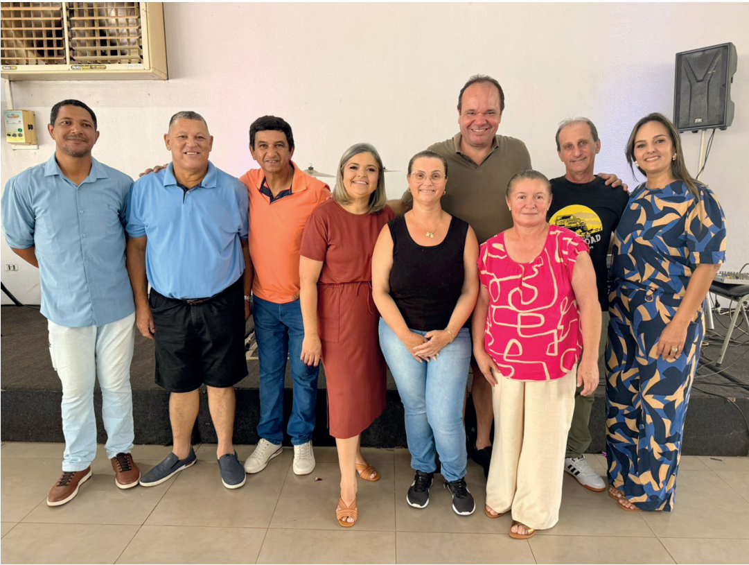
A confraternização dos servidores de Prado Ferreira

■ Evento de confraternização dos servidores públicos aconteceu no salão de festas da empresa Takei