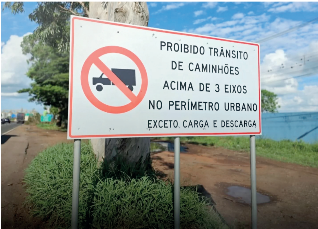
Motoristas e caminhoneiros já são alertados pelas placas colocadas nas entradas da cidade

A Secretaria de Segurança Pública, Trânsito e Mobilidade Urbana (SESTRAN) fica na avenida dos Expedicionários, nº 426, Rolândia. Seu horário de atendimento é de segunda a sexta-feira, das 12 às 18 horas. O telefone para contato é o (43) 3255-8698.