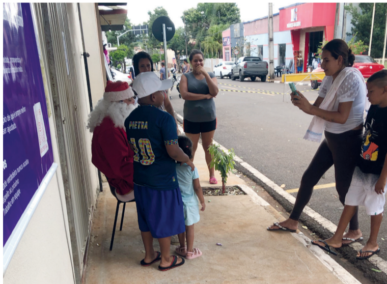
Papai Noel atende as crianças, que formaram filas na festa

■ Agência dos Correios de Prado Ferreira recolhe cartinhas das crianças e repassa para as pessoas ‘apadrinharem’; festa é para a entrega dos presentes pelo próprio Papai Noel