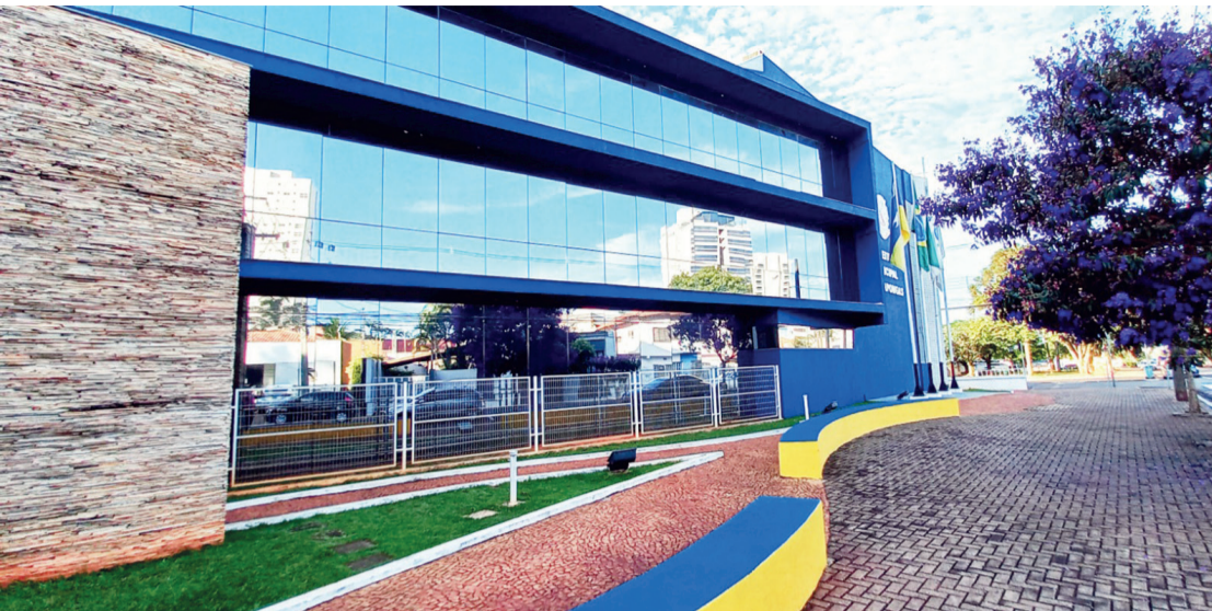
A prefeitura de Arapongas

■ Gestão Integrada de Resíduos Sólidos é tema de audiência pública, no dia 23 de janeiro, no auditório do Paço Municipal