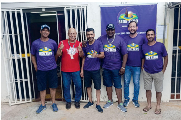
A turma da Sede Zero também ajudou na festa