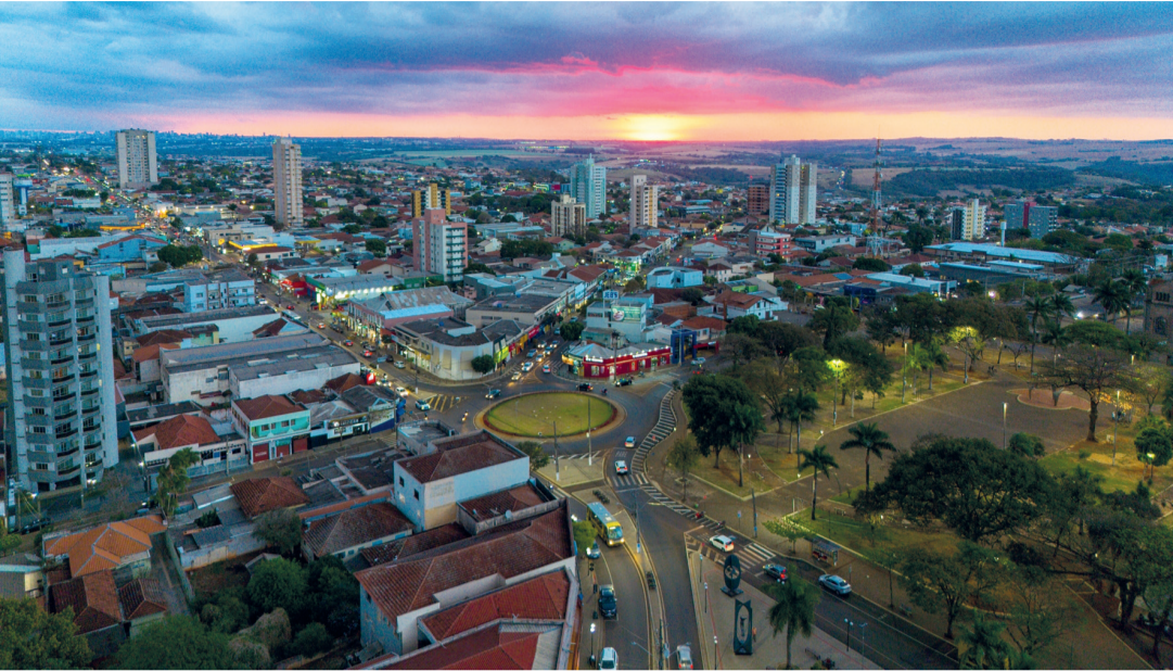
Prefeitura de Ibiporã fecha no dia 31 de dezembro e volta no dia 2 de janeiro

■ Serviços essenciais serão mantidos pela Administração Municipal durante o feriado de Ano Novo