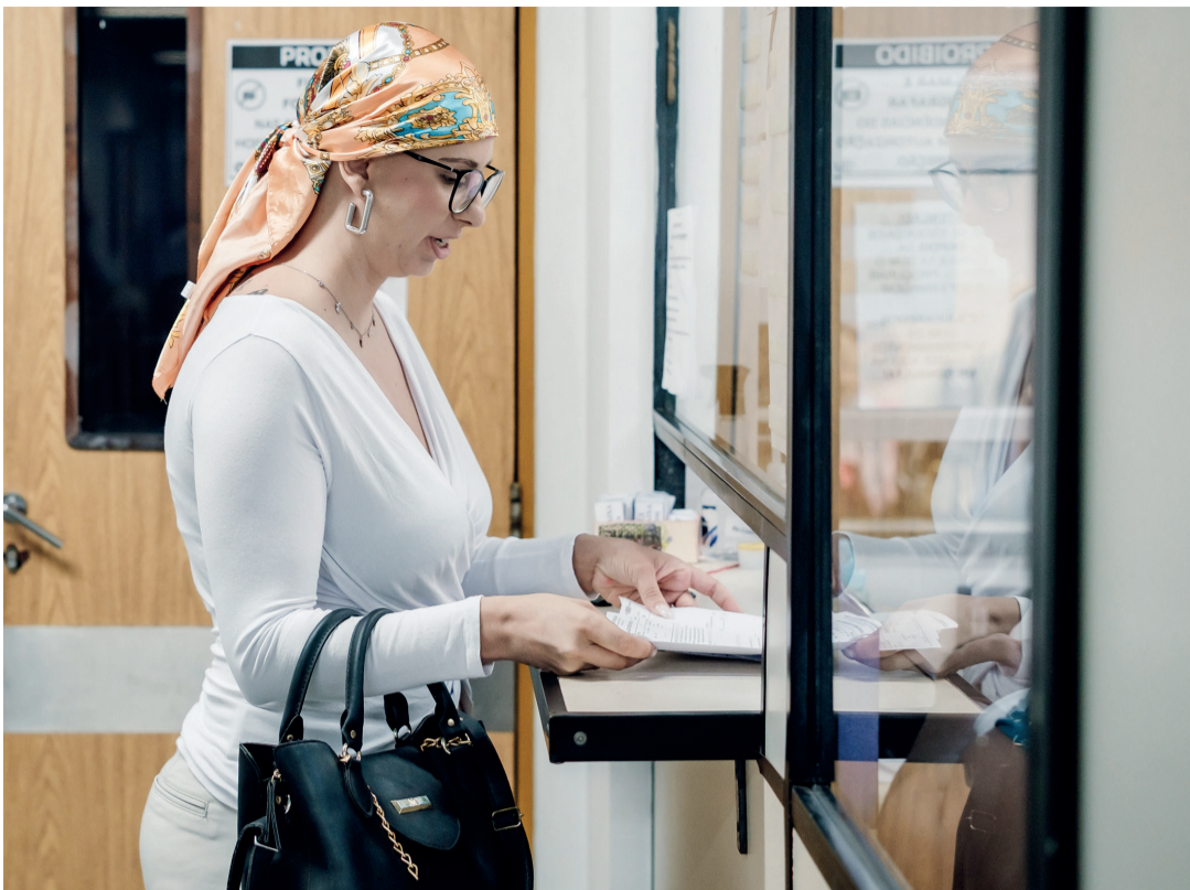
AS MULHERES SEMPRE NO CENTRO: a foto acima é da série ‘O Caminho Rosa’ e a foto ao lado se refere ao grupo de matérias sobre a menopausa

Uma das matérias mais elogiadas do ano foi sobre