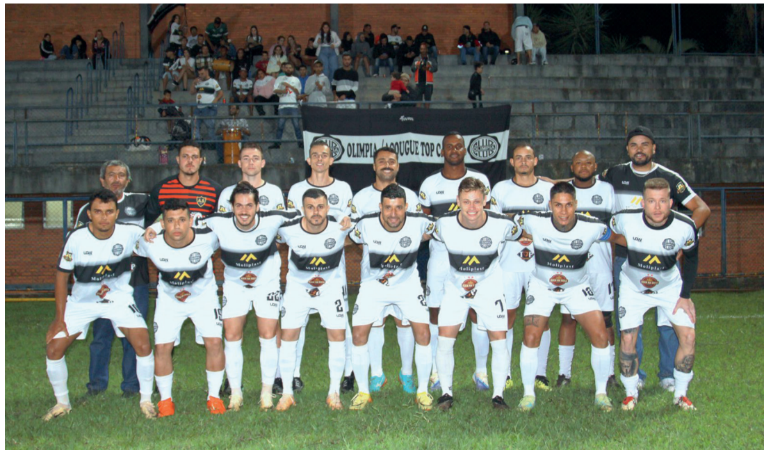
O Olímpia é campeão da 2ª edição da Taça Arapongas

■ De virada, Olímpia supera Arena G9 e vence a competição em 2025; final do torneio de futebol de campo ocorreu na semana passada