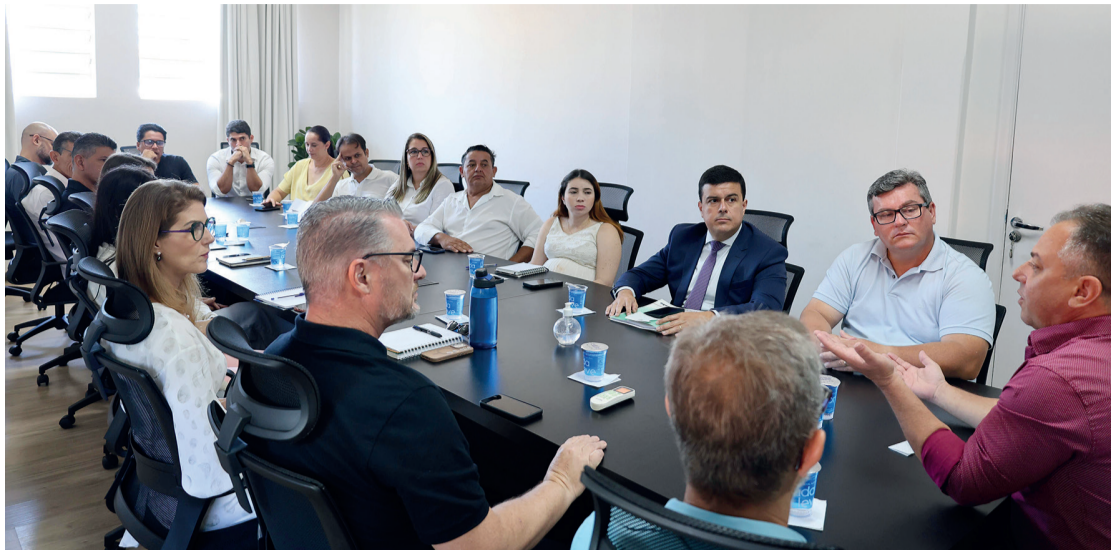
Reunião aconteceu no gabinete da prefeitura

■ Forças de segurança serão chamadas e comissão irá analisar melhorias na legislação de Cambé para prevenir esse tipo de ataque