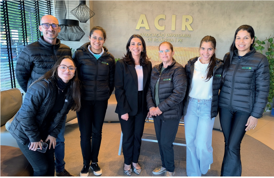
A galera da ACIR no sorteio realizado em agosto de 2025

O Sorteio de Natal da ACIR será transmitido ao vivo pelo Grupo JR, no Facebook/UmJornalregional, Rádio Cultura FM 87.5 e pelo Instagram da ACIR (@acirrolandia).