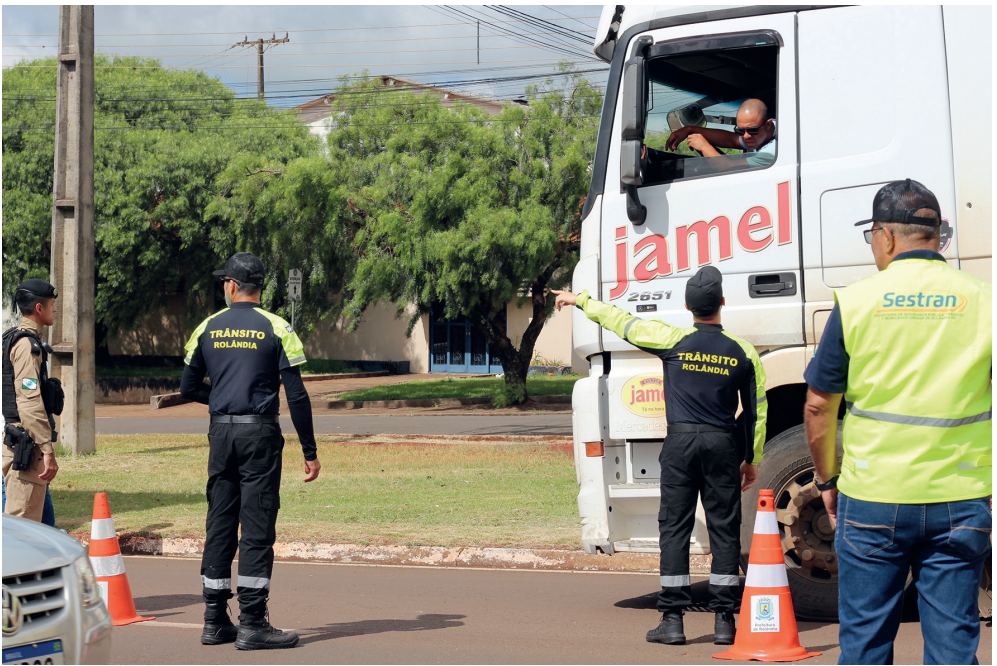
Agentes de trânsito e policiais militares fazem orientações aos motoristas de caminhões pesados, na quinta-feira, na PR-170

A lei que restringe o tráfego de veículos pesados na área urbana de Rolândia entrou em vigor nesta semana, na quinta (8). Com isso, caminhões acima de três eixos, sem a Autorização Especial de Tráfego (AET), têm de ‘contornar’ a cidade para evitar o trecho urbano e, assim, também as autuações e possíveis multas. Várias placas foram instaladas nas entradas do município com informações sobre a restrição e indicando as rotas que esses veículos devem seguir.