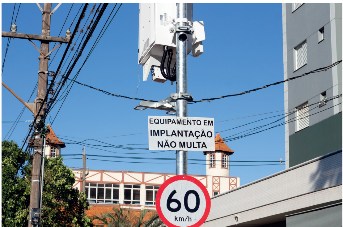
Equipamentos passam a autuar a partir do dia 19 de janeiro

De acordo com o Departamento de Trânsito (DETRAN-PR) e a Polícia Militar, o município registrou um aumento de 34,7% a mais em 2025 do que em todo o ano de 2024 em sinistros (acidentes): no total foram 427 sinistros com 754 veículos envolvidos (30% a mais do que em 2024); 859 pessoas afetadas (+30%), com 167 vítimas com ferimentos (+ 40%) e 8 óbitos (+ 166%). Esses números foram computados do dia 1º de janeiro até o dia 12 de novembro. Em 2024, foram 317 sinistros com 578 veículos envolvidos e 658 pessoas afetadas: 119 vítimas com ferimentos e três óbitos.