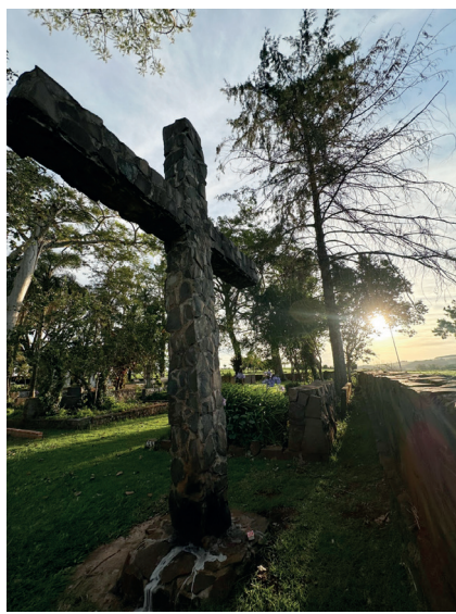
Roland: liberdades... (1ª à esq.) Manhã de Domingo... Cruz sob o ... Torre da Matriz... Rolândia Colonizada (abaixo, à dir.)