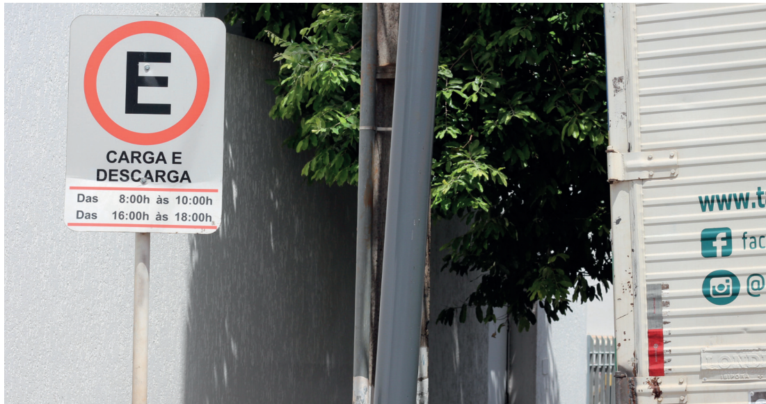
Caminhão entrega mercadorias na rua Monteiro Lobato fora do horário permitido

A Associação Empresarial de Rolândia (ACIR), em parceria com a Secretaria de Trânsito (Sestran), realiza um bate-papo aberto com comerciantes para discutir as regras de carga e descarga na cidade. O encontro acontece na próxima quinta-feira, dia 22 de janeiro, às 18h30, no auditório da ACIR (Avenida Tiradentes, 555). A reunião surge diante da necessidade de organizar e atualizar a aplicação da Lei Complementar nº 57/2011, que regulamenta as operações de carga e descarga na área central do município, mas que, segundo a Sestran, hoje não vem sendo respeitada na prática.