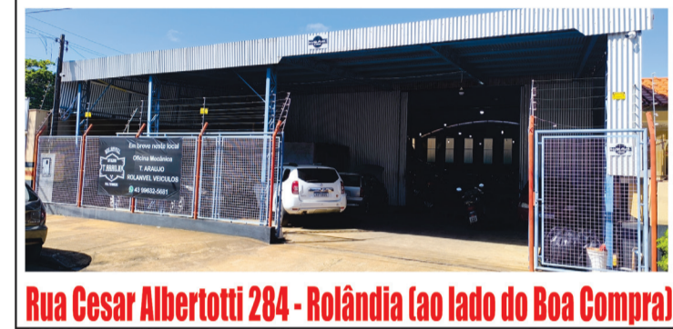
Rua Cesar Albertotti 284 - Rolândia (ao lado da Boa Compra)