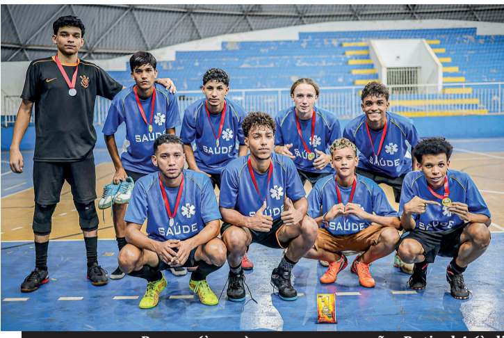
Bayern (à esq.) sagrou-se campeão; Batigol A (à dir.) foi o vice e Herions (abaixo) ficou com a 3ª colocação

Evento da FJU promove o esporte, a saúde e a alimentação saudável entre a juventude