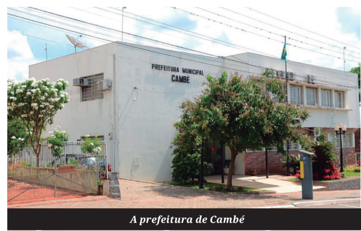
A prefeitura de Cambé

A mesma lógica se aplica a terrenos vazios. Parte deles já estava com as informações corretas, enquanto outros apresentavam defasagem cadastral, situação que, conforme a Prefeitura, gerava distorções e tratamento desigual entre contribuintes.