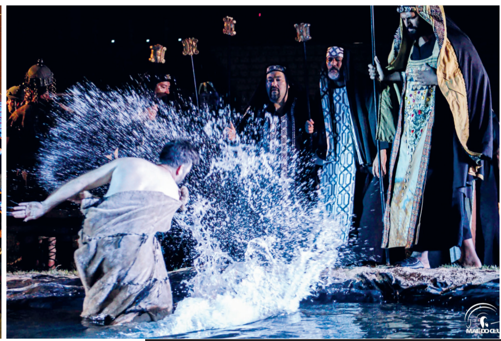
Imagens de encenações da 'Paixão de Cristo' pela região em 2025