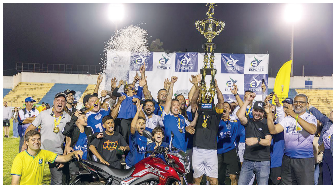
O time Gralha Azul é o último campeão do 1º de Maio de Arapongas - equipe tem 9 títulos

■ Competição é uma das maiores do Brasil e promete agitar a cidade; Secretaria de Esporte divulgou os dados da edição de 2026