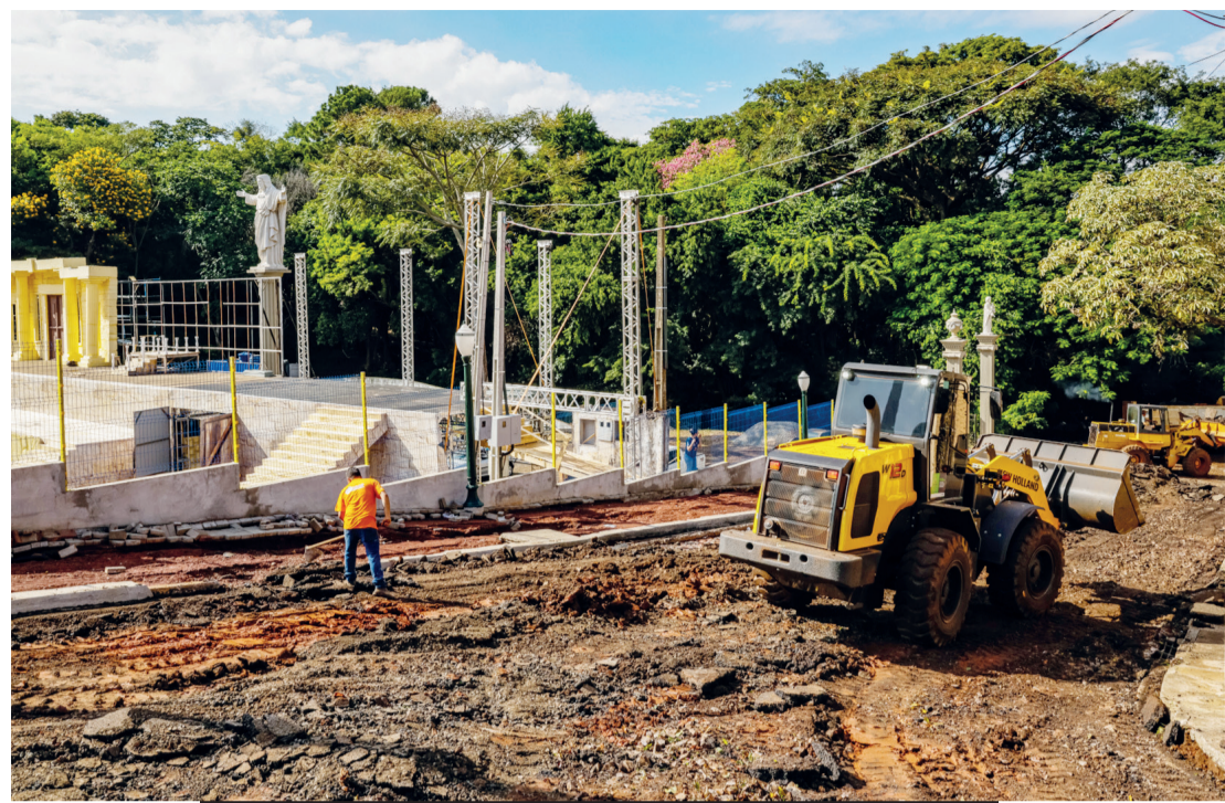
A chuva intensa e rápida provocou muitos estragos em Arapongas

Segundo dados da Assistência Social (SEMAS), foram atendidas seis famílias, num total de 21 pessoas. “Nós temos duas famílias desalojadas, que é a situação quando essas pessoas são reencaminhadas