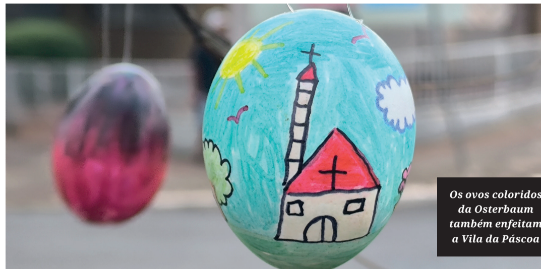
Os ovos coloridos da Osterbaum também enfeitam a Vila da Páscoa

■ Evento acontece simultaneamente na Vila Oliveira e no Calçadão central com atividades culturais, artísticas e recreativas