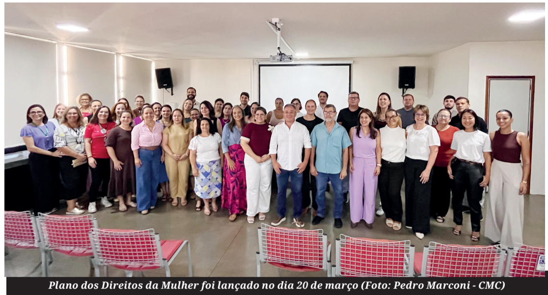
Plano dos Direitos da Mulher foi lançado no dia 20 de março

■ Prefeitura lança, pela primeira vez, um Plano dos Direitos da Mulher