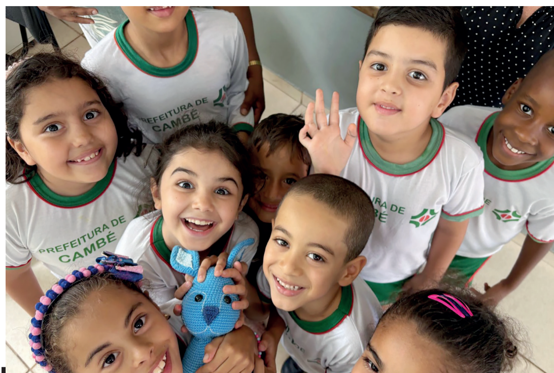
Crianças da rede municipal de ensino de Cambé, no Norte do Paraná

Município supera meta e bate recorde em índice de crianças alfabetizadas em sua rede municipal