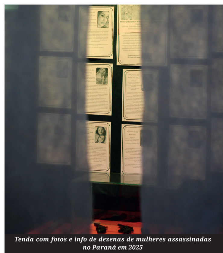
Tenda com fotos e info de dezenas de mulheres assassinadas no Paraná em 2025

A ambientação do memorial também busca provocar reflexão no público. Elementos simbólicos foram utilizados para representar situações de violência, gerando impacto visual. "A gente quis causar um certo desconforto, porque a conscientização também passa por isso", explica Luana. A exposição também traz relatos de mulheres que vivenciaram situações de violência e conseguiram romper o ciclo. Os depoimentos foram reunidos com apoio do CRAM e destacam trajetórias de superação. "São histórias de