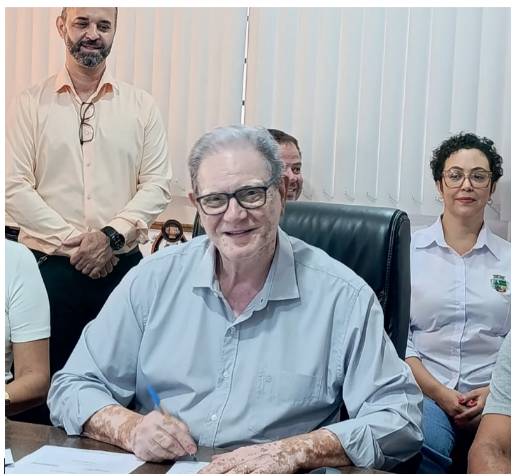
Ordem de Serviço para obra de quase R$ 20 milhões

O secretário municipal de Educação, Atef