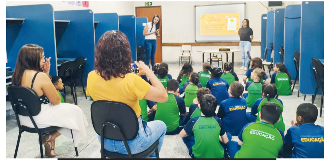
Alunos do 4º ano da Sebastião Feltrin

■ Iniciativa leva orientações sobre proteção e prevenção à violência para estudantes do 4º ano