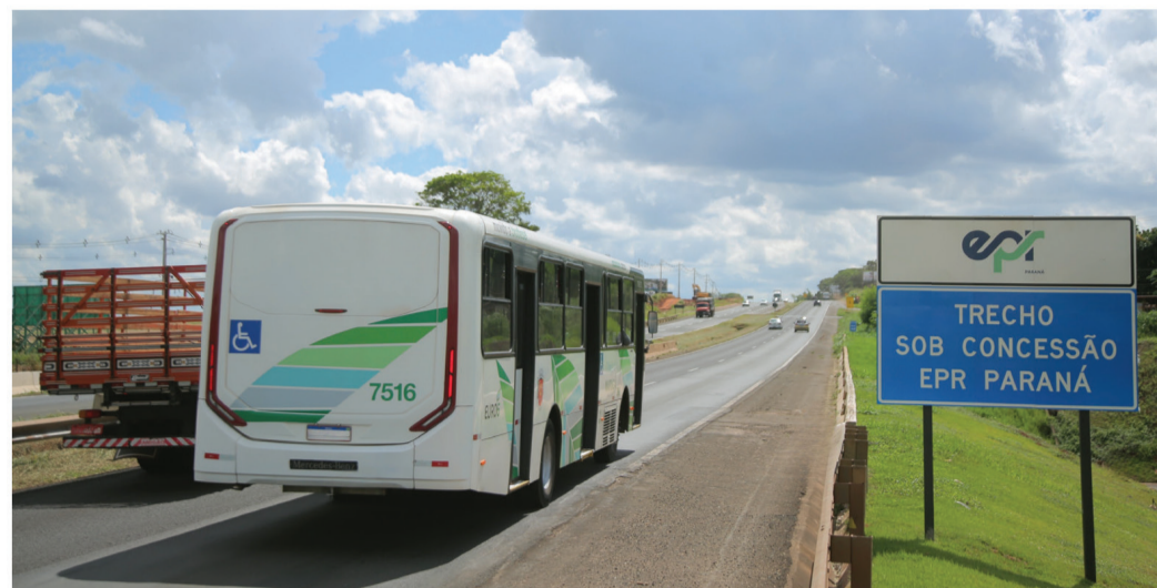
Legenda: Rodovias administradas pela EPR no Norte, Noroeste e Oeste do Paraná já recebem melhorias, contam com atendimento 24 horas aos usuários e terão tarifas com descontos progressivos para motoristas frequentes.

Os serviços incluem atendimento pré-hospitalar, guinchos para veículos leves e pesados, caminhões-pipa e veículo para remoção e manejo de animais. As equipes, que percorrem os trechos administrados regularmente para identificar ocorrências, prestar auxílio e garantir mais segurança aos usuários, podem ser