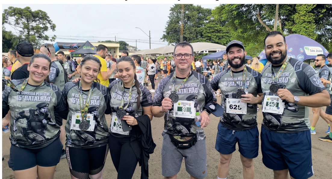
Participantes da 4ª Corrida Solidária do 15º BPM em 2025

■ Inscrições para o evento esportivo vão até 15 de abril e corrida acontece no dia 26 com ações e atrações no pátio do Batalhão