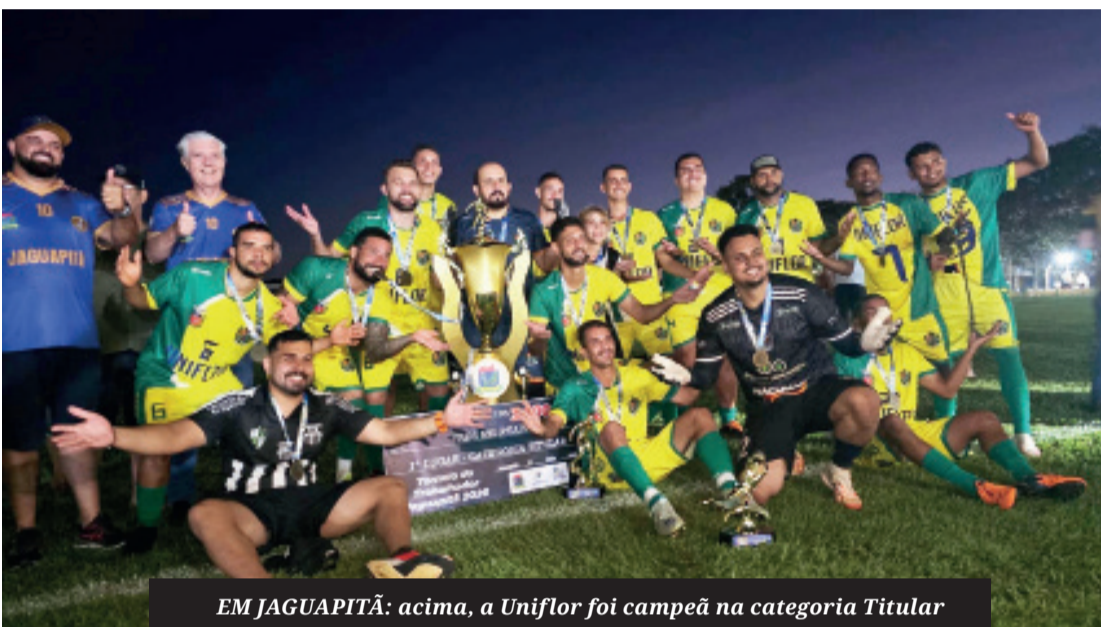
EM JAGUAPITÃ: acima, a Uniflor foi campeã na categoria Titular e, abaixo, a equipe Ágius, de Rolândia, que venceu na Aspirantes