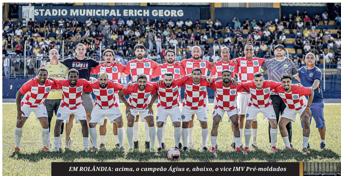
EM ROLÂNDIA: acima, o campeão Ágius e, abaixo, o vice IMV Pré-moldados

Em Arapongas, foram cinco categorias de futebol em disputa. Na principal, a Adulto, a Arena G9/Cardios/LJ Imóveis foi campeã; a categoria Máster 40+ foi vencida pela equipe PB Empreendimentos B/ Buffet Planeta Criança; na Máster 50+, destaque para o time Ferrari Construtora; no Feminino, o campeonato foi para Felícia Lanches e, no Masculino sub-16, Bambino Sub-16 foi o campeão.