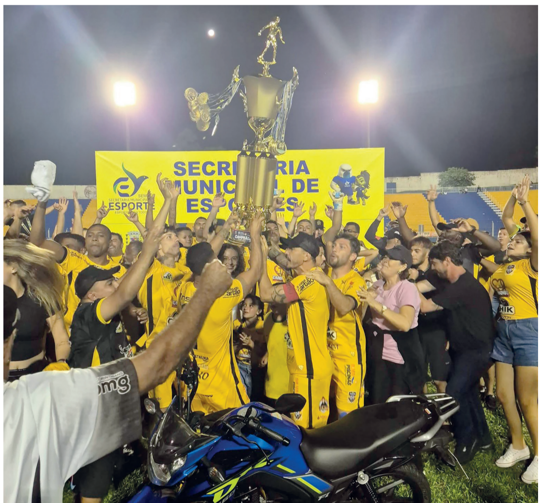
EM ARAPONGAS: acima, a campeã Arena G9/Cardios/LJ Imóveis EM CAMBÉ: abaixo, Soller Fc/Cambé Mil Grau 1