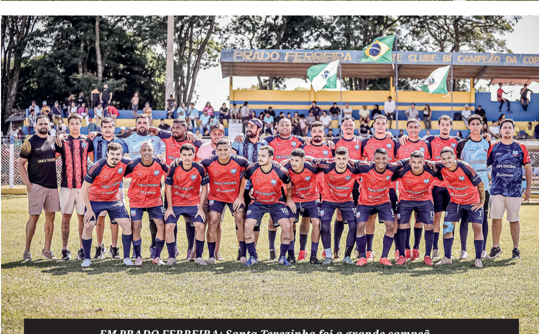
EM PRADO FERREIRA: Santa Terezinha foi a grande campeã