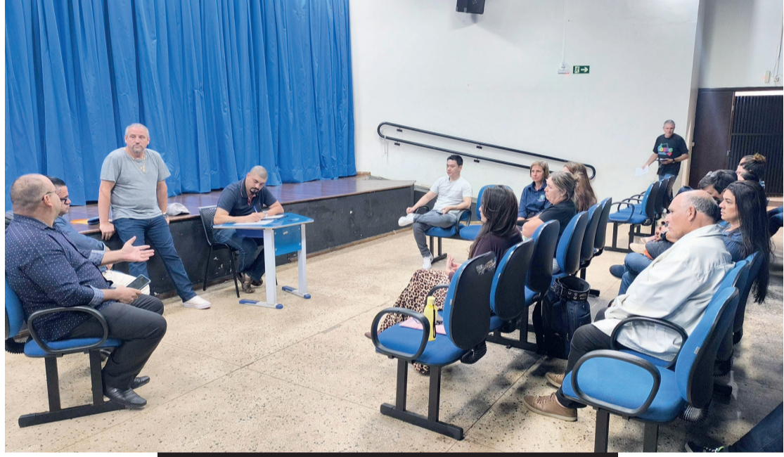
Conselheiros e conselheiras da Cultura ouviram sobre os projetos dos próprios representantes das entidades

■ Reunião do Conselho debateu emendas impositivas e referendou o repasse a projetos de três entidades na área de música