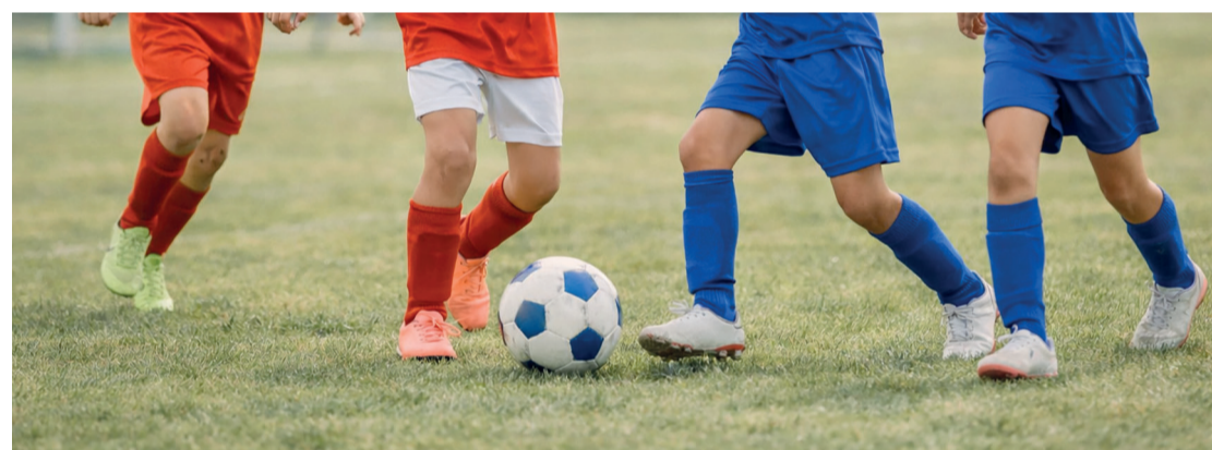
Meninos e meninas terão atividades e dinâmicas no Gol de Placa

A programação terá início às 9h da manhã e contará com diversas atividades voltadas ao público infantil e familiar. Entre as atrações estão partidas de futebol, chute a gol, brincadeiras, dinâmicas, brinquedos infláveis, distribuição de