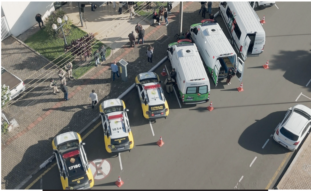
Veículos foram estacionados em frente à prefeitura de Cambé

■ Prefeitura reforça serviços com a entrega de ambulâncias, viaturas para a PM e van para o esporte