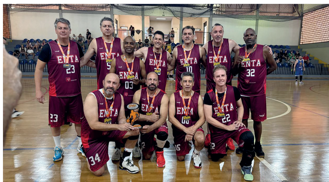
Jogadores da equipe de Basquete de Rolândia

■ Torneio começa na noite desta sexta com jogos nas categorias 40+ e 50+; evento esportivo tem entrada gratuita