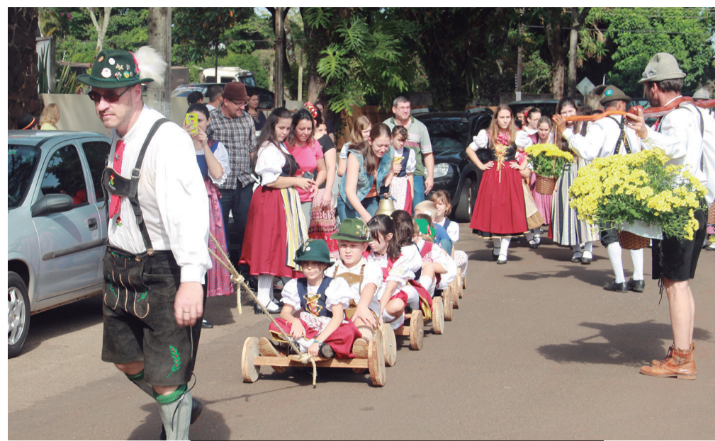
Desfile promove a Erntedankfest de 2017

Outra atração à parte é a banda 'Os Meninos de Ouro', que anima toda a festa com sua música típica e que coloca todos para dançarem. A Erntedankfest da Luterana de Rolândia reserva, ainda, um dos momentos mais esperados